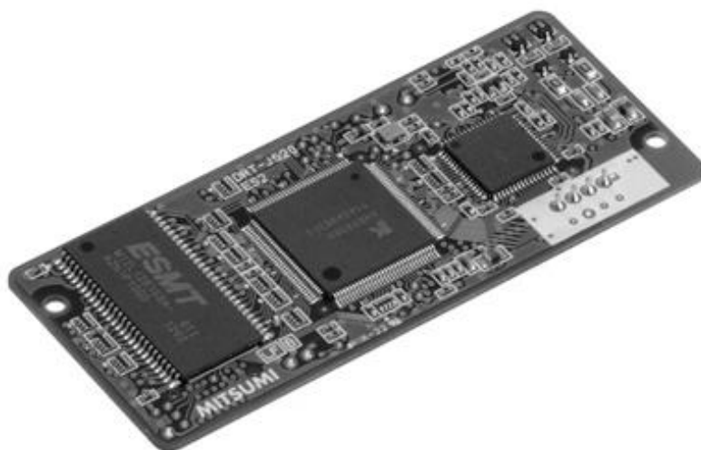
Slika 3.6. HD-PLC Modul DRT-J550

Jedan od mnogih modula koji koriste IEEE 1901 je HD-PLC Modul DRT-J550. Velike brzine prijenosa podataka su moguće pomoću postojećih vodova, kao što su vodovi unutar kuće. DRT-J550 koristi frekvencijski pojas od 2 do 28 MHz. Brzina prijenosa podataka na fizičkom sloju se kreće do 240 Mbps. Ima malu potrošnju energije.