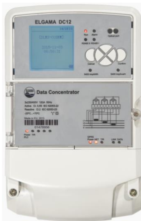
Slika 3.1. ELGAMA DC12 podatkovni koncentrator