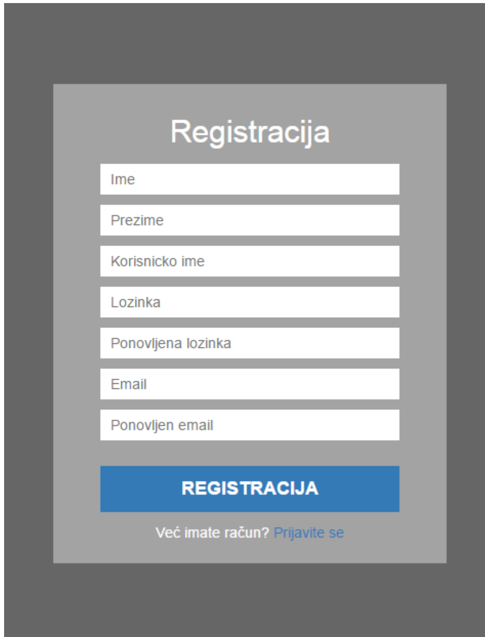
Sl. 4.2 Obrazac za registraciju

Registracija u sustav vrši se preko obrasca napisane u HTML-u, a preko "POST" metode šalju se podaci u bazu podataka, a kao akcija, preko koje će se poslati ti podaci, postavlja se na ime skripte koja je napisana za registraciju.