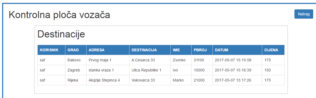
Sl. 4.12. Kontrolna ploča vozača

Pritiskom na „destinacije“ otvara se tablica gdje vozač ima pregled svih narudžbi koje su zatražene od strane registriranih korisnika. U tablici su navedeni samo najbitniji atributi koji su važni vozaču za njegovu dostavu naručenog paketa. Pritiskom na gumb „natrag“ vraća se na početnu stranicu vozača. Tablica destinacija prikazana je na slici 4.12.