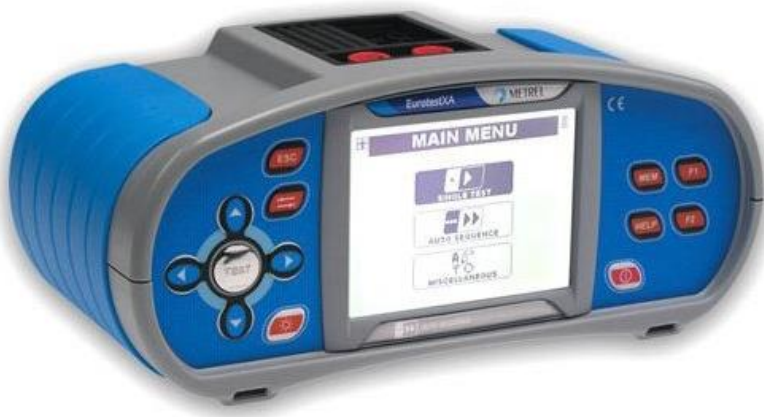
Slika 4. -Univerzalni uređaj za ispitivanje NN električnih instalacija [6]

Kao primjer univerzalnog uređaja za ispitivanje NN električnih instalacija dan je uređaj tipa METREL Eurotest XA. Ono na što posebno treba obratiti pozornost kod nabave ovakvih mjernih i ispitnih uređaja jest to, da li je uređaj umjeren, ima li tipsko odobrenje u Hrvatskoj, ima li naputak za uporabu na hrvatskom jeziku, ima li servis u Hrvatskoj, te odabrati konfiguraciju koju će te doista i koristiti. Dobro je da uz uređaj ide i certifikat proizvođača s podacima za umjeravanje iako se umjeravanje može obaviti u nekoj od ovlaštenih ustanova u Hrvatskoj (npr. CEI-IETA d.o.o., ili KONČAR Institut – odjel za umjeravanje).