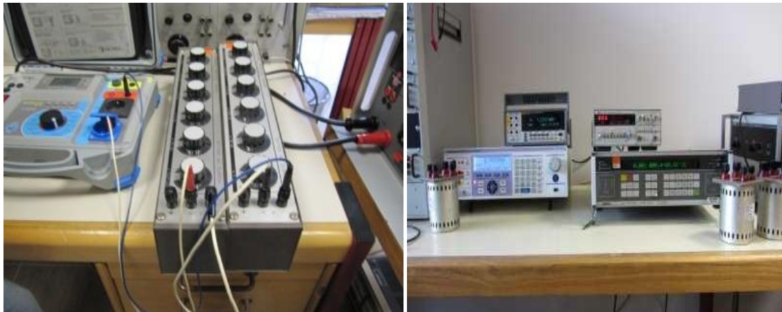
Slika 5. i slika 6. - Aparat za ispitivanje aparata KONČAR [8]

U procesu provjere kontrole kvalitete nebi trebalo doći do nesukladnosti, iako nesukladnost ne znači nužno da je proizvod škart, tako da je moguće da se na jednom proizvodu pojavi par sitnih nesuglasnosti ali da proizvod ipak zadovolji uvjete kvalitete. Laboratorij za umjeravanje Končar je prvi mjeriteljski laboratorij u Republici Hrvatskoj, te djeluje unutar Končara više od 55 godina.