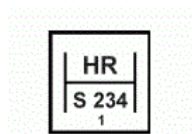
Slika 3. – Žig za dokumente ovlaštenog servisa [5]

Mjeriteljstvo se dijeli u znanstvene, tehničke i zakonske svrhe :