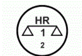
Slika 2.- Žig za dokumente ovjeravatelja [5]

Svako mjerilo koje se planira koristiti kroz područje zakonskog mjeriteljstva obvezno je sadržavati valjani ovjerni list sa potpisom i žigom ovjeravatelja na njemu. Prije početka korištenja, sva mjerila se moraju posebno ispitati. Ako mjerilo zadovolji zahtjeve navedene u tipskom odobrenju, ispravnost mjerila se označava žigom sljedećeg oblika: