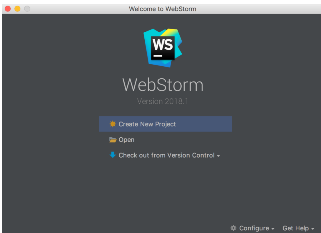
Slika 2.1. Izgled WebStorm IDE-a

WebStorm je inteligentan IDE koji pruža pomoć pri pisanju programskog koda za JavaScript, HTML i CSS te široku lepezu modernih web tehnologija uključujući i AdonisJs. WebStorm obuhvaća klijent-stranu prilikom razvoja programskog koda i razvoja na server strani.