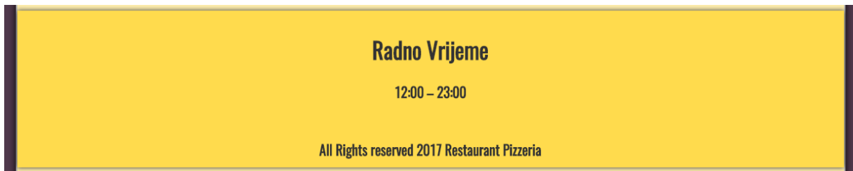
Slika 3.2. – Prikaz podnožja stranice

Na svakoj se kartici (Naslovna, Menu, Kontakt i Prijava) ispod navigacijske trake nalazi sadržaj sukladan nazivu te kartice. Sadržaj svakog prozora ću naknadno prikazati. Sada se fokusiram na zajedničke elemente. Na dnu svake kartice nalazi se podnožje sa informacijom o radnom vremenu restorana. Slika 3.2. prikazuje izgled podnožja stranice ( engl. footer ).