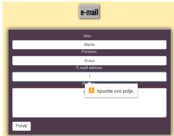
Slika 3.7. – Kontakt forma za slanje elektroničke pošte