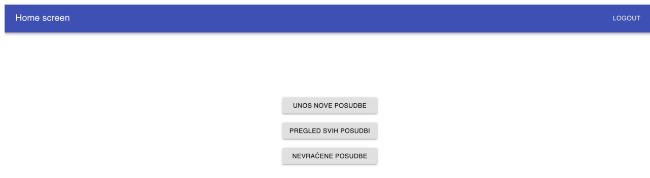
Slika 3.7. Prikaz glavnog zaslona aplikacije

Nakon unosa e-maila i lozinke korisnik je preusmjeren na glavni zaslon aplikacije gdje može izabrati jednu od tri ponuđene opcije(Slika 3.7).