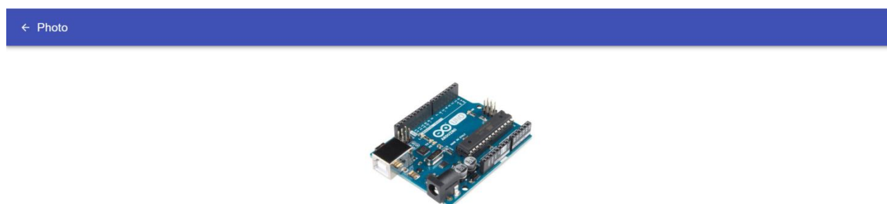
Slika 3.13 Slika posuđene stvari

Klikom na PRIKAZI SLIKU prikazuje se slika posuđene stvari (Slika 3.13).