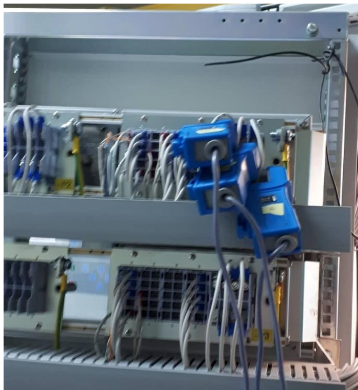
Slika 5. Spoj strujnih kliješta u strujnom ormaru