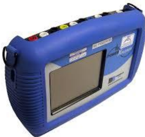
Slika 1. PowerXplorer 5

Na gornjem dijelu uređaja nalaze se četiri strujne i četiri naponske priključnice. Na prednjem djelu instrumenta nalazi se LCD zaslon s „touchscreen“ tehnologijom koja služi za korištenje instrumenta i odabir željene funkcije.