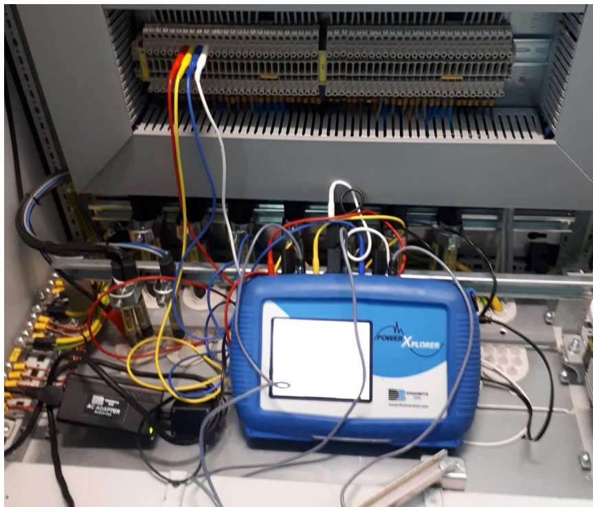
Slika 4. Spoj naponskih stezaljki u mjernom ormaru