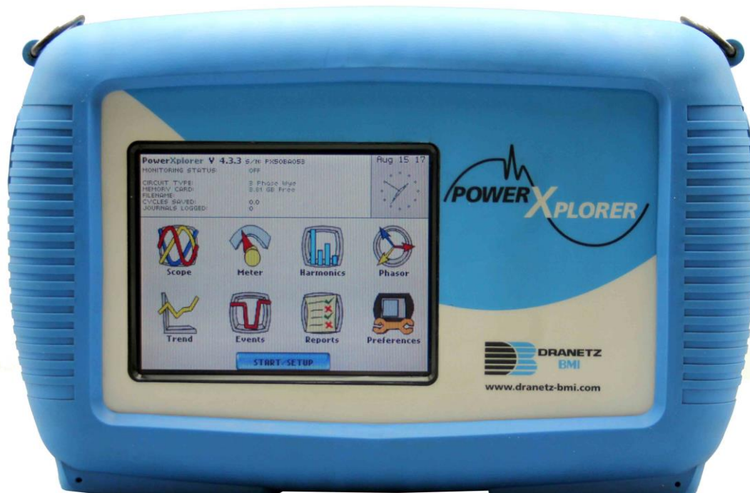
Slika 2. Zaslona Power Xplorer 5 uređaja

Na poledini se nalazi polje s punjivim zamjenjivim baterijama. S donje strana instrumenta nalazi se memorijska kartica, tri LED diode i prekidač te utor za punjenje baterija. Memorijska kartica služi za pohranjivanje podataka pri nadzoru parametara. Za PX5 mora se koristiti memorijska kartica proizvođača DRANTZ – BMI zbog brzine pohrane podataka. Odjednom može sadržavati više memorijskih kartica ali mogu raditi samo jedna po jedna. Gledajući s lijeva na desno, prva LED dioda nam govori o stanju baterije. Ako mirno svijetli znači da se baterija puni, a ako titra znači da je baterija puna. Srednja LED dioda ne svijetli instrument radi normalno, no ako se utvrdi abnormalno stanje ova LED dioda će se upaliti. Zadnja LED dioda pri normalnom radu titra jednom po sekundi. Početni zaslon možemo podijeliti na četiri dijela. Na vrhu zaslona nalaze se informacije o stanju što uključuje stanje nadzora, stanje memorijske kartice, ime i oznaku datoteke te vrijeme i datum. Prvi red ikona povezan je s trenutnim mjerenjima i pokazuje trenutne veličine parametara. Drugi red ikona služi za prikaz pohranjenih datoteka (kao grafikone ili kao valne oblike) te izvješća o podacima norme EN50160. Također se u drugom redu nalaze i postavke instrumenta. Na dnu zaslona nalazi se tipka START koja omogućuje pokretanje nadzora električne energije [7].