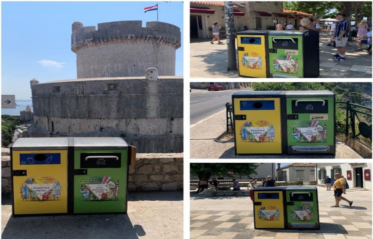
Slika 2.1. Pametni spremnici otpada u Dubrovniku[4].