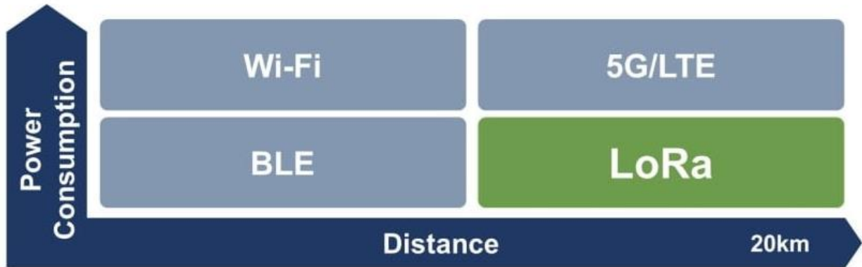
Slika 3.1. Usporedba potrošnje energije sa dometom komunikacije kod 4 različita sustava komunikacije[6].

Primjer upotrebe LoRaWAN tehnologije u energetici i za potrebe komunalnih poduzeća je aplikacija za pametno očitavanje brojila. Tvrtke koje se bave proizvodnjom i prodajom energenata tu aplikaciju koriste za lakše očitavanje i obračunavanje potrošnje kod korisnika njihove usluge. Komunalne tvrtke ju mogu koristiti za očitavanje razina spremnika otpada ili za očitavanje potrošnje ili odljeva vode u sustavu.