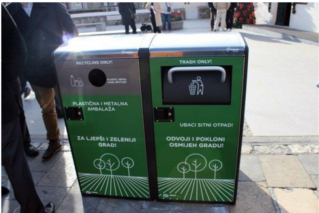
Slika 2.2. Pametni spremnici otpada u Dubrovniku[4].