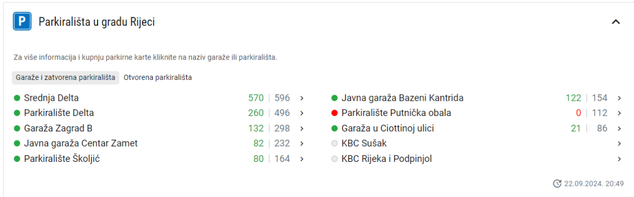
Slika 3.2. Prikaz popunjenosti otvorenih parkinga i garaža na RCC portalu[7].

Za primjer upotrebe prikupljanja senzorskih podataka kod praćenja popunjenosti parking možemo uzeti grad Rijeku koji je uveo sustav koji prati stvarno stanje popunjenosti garaža i otvorenih parkinga u gradu te informacije o istome dostavlja građanima putem portala „Rijeka City Card“.