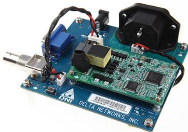
Slika 3.3. Izgled SGCM-P40

propusnost između odašiljača i prijemnika. Radna frekvencija mu je od 145,3 do 478,12. Flash memorija 512 kb, RAM memorija: 64 kb.