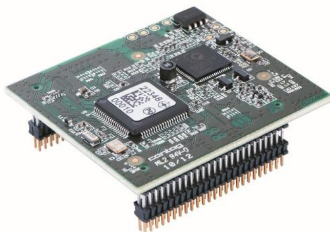
Slika 3.7. dLAN® Green PHY modul

dLAN® Green PHY modul je integriran uređaj za odašiljanje i primanje podataka putem električnih vodova. Ona ima sve funkcije potrebne za jednostavno kreiranje Green PHY mrežnih uređaja. Njegova brzina prijenosa podataka putem vodova se kreće do 10 Mbps. Njegov domet je 600 metara putem koaksijalnog kabela, 400 metara putem telefonske linije i 300 metara putem vodova. U potpunosti je kompatibilan sa GreenPHY i HomePlug AV standardima. Kupcima je omogućeno dodavanje ili prilagodba funkcija mijenjanjem upravljačkog softvera. Izvor 3,3 V, potrošnja energije < 1,5 W. Olakšava razvojni ciklus, montažu, testiranje i certifikaciju odobrenja.