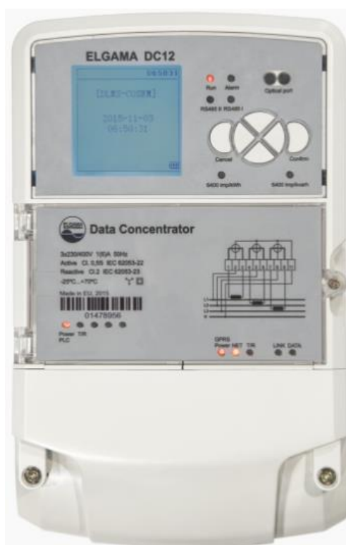
Slika 3.1. ELGAMA DC12 podatkovni koncentrator