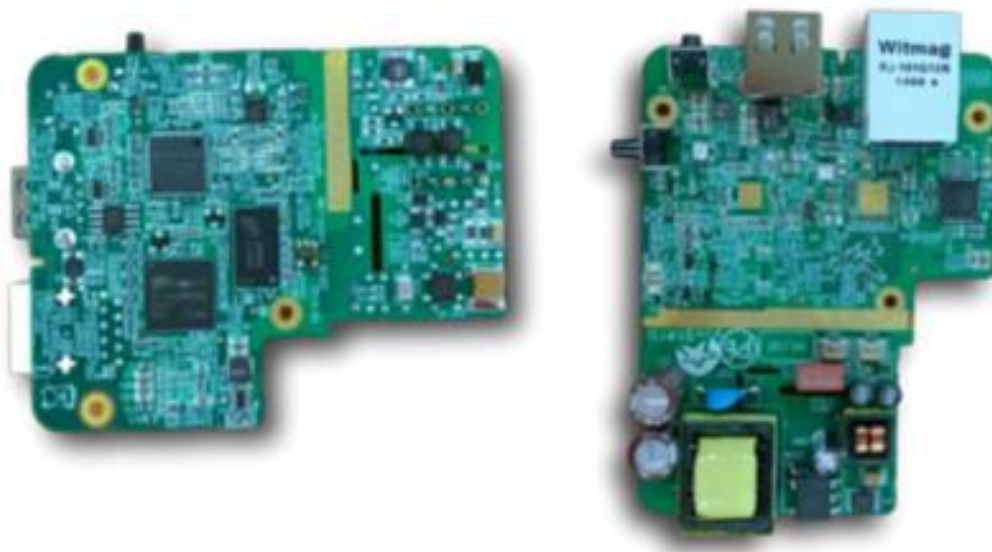
Slika 3.5. Merryvale G.hn PLC modul

Modul koji radi na ITU-T standardu je Merryvale G.hn PLC modul. Podržava frekvencijske pojase od 25, 50 i 100 MHz. Ovaj integrirani uređaj objedinjuje sve funkcije G.hn PHY i G.hn MAC slojeva. Raspon napona na kojem radi je od 110 do 240 V izmjenično. Podržava topologiju mreže do 8 čvorova. PHY sloj radi retransmisije kako bi prevladao trenutne impulse šuma i garantira isporuku podataka.