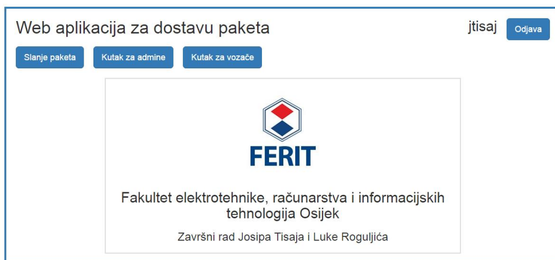
Sl. 4.1 Početna stranica

Naslovna stranica aplikacije napisana je u HTML-u, a korišten je Bootstrap za responzivni dizajn. Vidimo da ima prijava i registracija, ali njih ćemo u idućim poglavljima objasniti. „Slanje paketa“ služi prijavljenom korisniku da naruči slanje paketa na destinaciju koju on želi. „Kutak za admina“ služi da se administratori aplikacije logiraju i onda se vidi cijela povijest naručivanja svih registriranih korisnika. „Kutak za vozače“ služi da vozač koji dobije narudžbu vidi gdje ta narudžba mora biti dostavljena. Prikazano na slici 4.1.