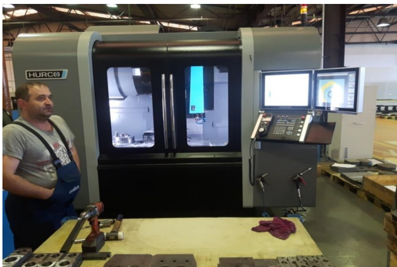
Slika 2.3. Obradni centar

Kontrola s dvostrukim zaslonom omogućava operateru da pregledava blokove programskih podataka na jednom zaslonu dok gleda prikaz dijela na drugom zaslonu [5]. Druge situacije često nastaju kada operator želi pogledati dva prikaza odjednom. Ova konfiguracija s dva zaslona pruža dodatnu fleksibilnost i poboljšava performanse i brzinu korisnika [5].