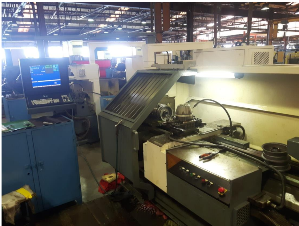
Slika 2.2. CNC tokarilica

U ovom pogonu se koristi CNC tokarilica koju možemo vidjeti na slici 2.2.