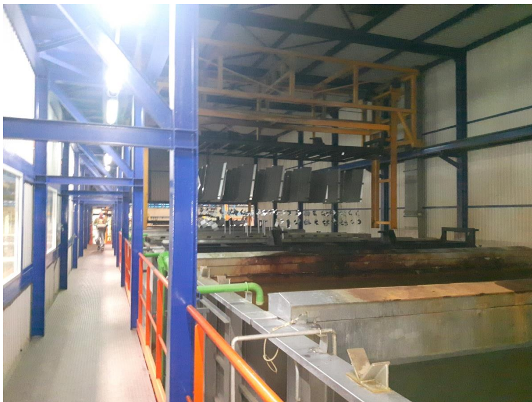
Slika 2.8. Linija kataforeze

Proces predtretiranja i bojanja započinje pripremom i vješanjem dijelova. Voditelj kataforeze dužan je osigurati sigurno i pravilno vješanje dijelova, te voditi evidenciju o ulazu i izlazu dijelova iz kataforeze [11]. Proces se nastavlja predtretiranjem u 11 faza procesa, svaka faza procesa je jedna kada (kupka). Kade su smještene u linijski raspored u zasebni tunel, unutar hale [11]. U kadama se površina dijelova tretira kemijski s ciljem odmašćivanja, antikorozivne zaštite i pripreme podloge za nanošenje završnog sloja boje. Tijekom procesa predtretiranja kemičar obavlja kontrolu procesnih parametara [11].