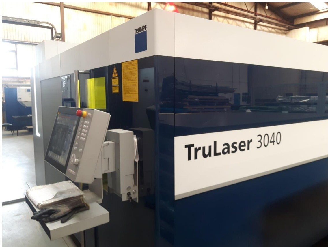
Slika 2.1. Laser za rezanje limova

Lasersko rezanje najčešće se koristi u industriji, što je primjer i kod ovog industrijskog pogona gdje se koristi TruLaser 3040 kojeg možemo vidjeti i na slici 2.1.