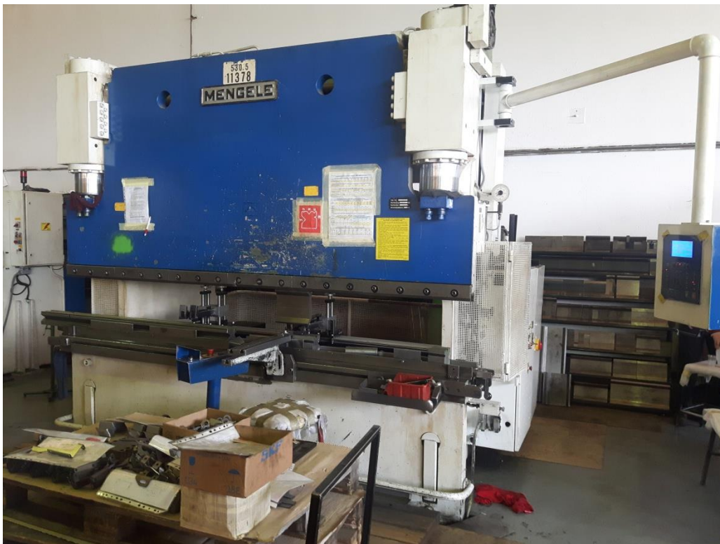
Slika 2.4. Stroj za deformaciju MENGELE

Da bi se materijal mogao prerađivati, potrebno ga je dovesti u stanje plastičnog tečenja, što znači da ga treba opteretiti iznad granice elastičnosti. Potreban rad i silu (opterećenje) ostvaruju strojevi za obradu deformacijom [6], u ovom slučaju MENGELE (slika 2.4.) i apkant presa za savijanje lima 250t.