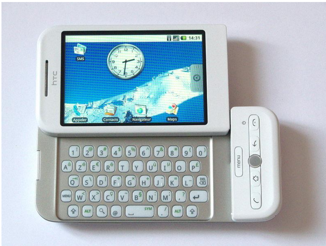
Slika 3. HTC Dream pametni telefon [10]

5. studenog 2007. godine, Open Handheld Alliance, skup tehnoloških tvrtki koji uključuje Google, proizvođače mobilnih uređaja poput HTC, Sony i Samsung, bežične operatere poput T-mobile te chipset proizvođače poput Texas Instruments, predstavio se javnosti sa ciljem razvitka javnih standarda za mobilne uređaje.[9] Tog dana, Android je predstavio svoj prvi proizvod, platformu za mobilne uređaje utemeljen na Linux jezgri. Prvi komercijalno dostupan pametan telefon sa Android operacijskim sustavom bio je HTC Dream, predstavljen 22. listopada 2008. godine.[1]