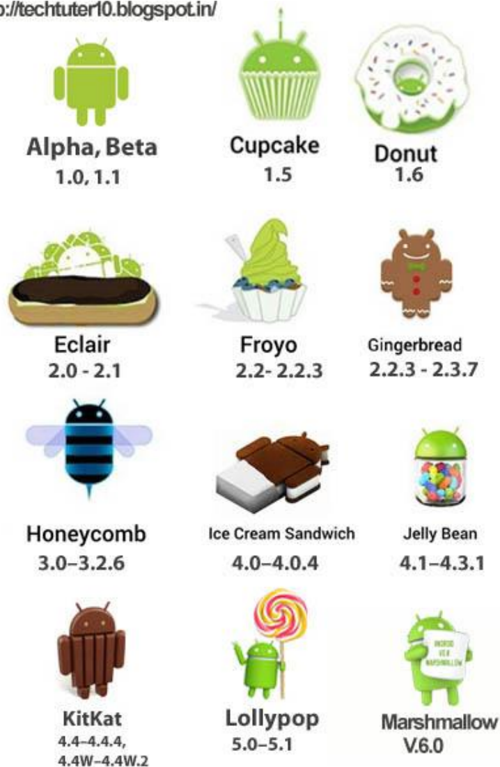
Slika 4. Dosadašnje verzije Android operacijskog sustava [11]