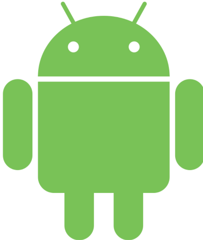
Slika 1. Logo OS Android [4]

Android je mobilni operacijski sustav trenutno u vlasništvu Google-a i OHA-a (Open Handset Alliance). Temelji se na Linux jezgri i dizajniran je primarno za pametne telefone sa ekranima osjetljivim na dodir te za tablete. Od 2013. godine je najprodavaniji operacijski sustav na tabletu i pametnim telefonima. [1]