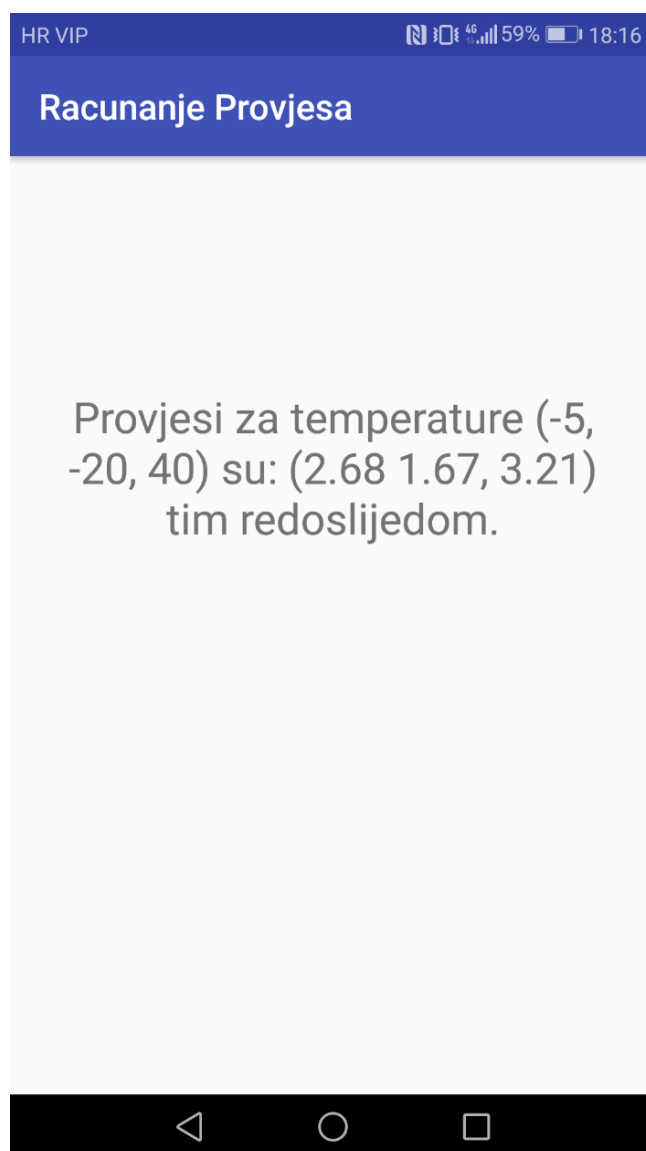
Slika 3.3 Prikaz rješenja

Pritiskom na dugme aplikacija pokazuje rješenje korisniku (slika 3.3).