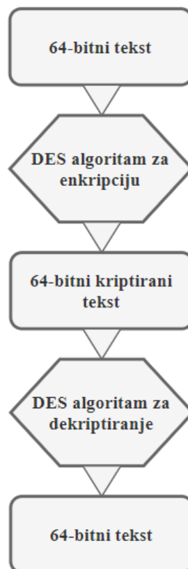
Slika 6.1. pregled rada DES enkripcije

Standard za enkripciju podataka (engl. Data Encryption Standard – DES) je standard razvijen za opću uporabu 1977. U DES standardu, sam algoritam za enkripciju je poznat, dok je ključ sakriven. Slika 6.1. daje pregled DES procesa. DES algoritam koristi 56-bitni ključ na 64-bitni blok teksta, što proizvodi 64-bitni blok kriptiranog teksta. Zbog toga se podatci pri kriptiranju razdvajaju na 64-bitne blokove. Unutar svakog bloka, znakovi se zamjenjuju i premještaju u skladu s vrijednosti ključa. Zbog relativno kratkog ključa, enkripcija se može poništiti unutar razumnog vremena što čini DES slabije sigurnom metodom.