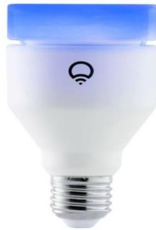
Slika 5.6 Lix žarulja u boji[11]

svojom infracrvenom žaruljom koja je namijenjena za proširivanje vidnog polja sigurnosnih kamera. Kako bi se povezali na mrežu nisu potrebni centralni uređaji, nego se oni spajaju direktno na Wi-Fi mrežu.[1]