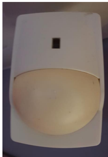
Slika 3.2 Primjer PIR detektora pokreta

Obzirom da svako tijelo sa temperaturom većom od apsolutne nule emitira toplinu u obliku infra-crvenog zračenja, za detekciju pokreta u protuprovalnim sustavima često se koriste uređaji koji u sebi imaju ugrađene PIR (engl. Passive infrared sensor ) senzore, odnosno pasivne infracrvene senzore s pripadajućim elektroničkim sklopom. Riječ pasivan ukazuje na to da senzor ne emitira infracrveno zračenje nego ga detektira. Osim senzora, PIR detektori (Slika 3.2) pokreta imaju ugrađene leće koje fokusiraju infracrveno zračenje iz okoline direktno prema senzoru. Odabirom leće te kombinacijom više njih, utječe se na udaljenost i širinu kuta detekcije uređaja. Najčešća udaljenost je do deset metara dok je širina kuta manja od 180°. Ovakvi uređaji postavljaju se na zidove ili plafone u