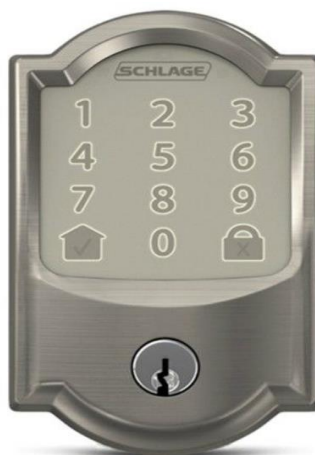
Slika 5.1 Schlage Encode vanjski dio brave[6]