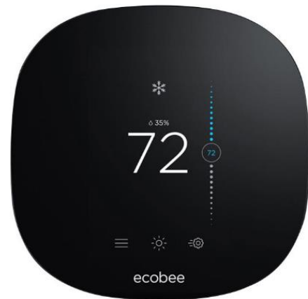
Slika 4.8 Ecobee 4 pametni termostat[13]