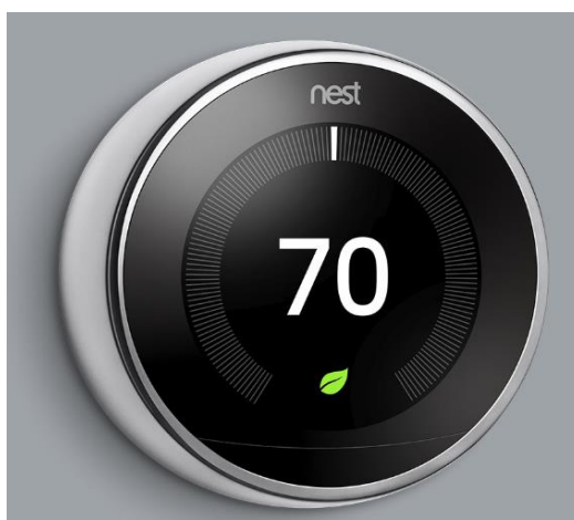
Slika 4.7 Google Nest Learning Thermostat[12]