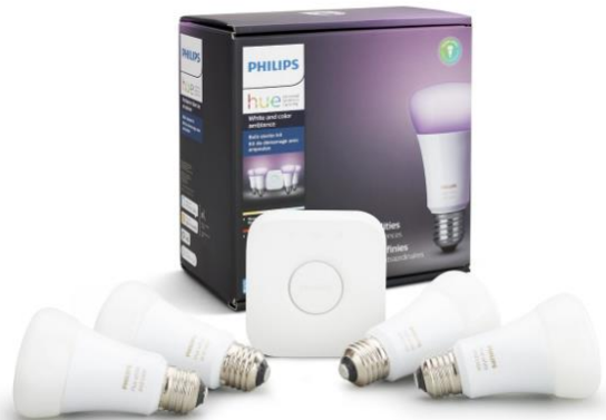
Slika 5.5 Philips Hue žarulje u boji [10]