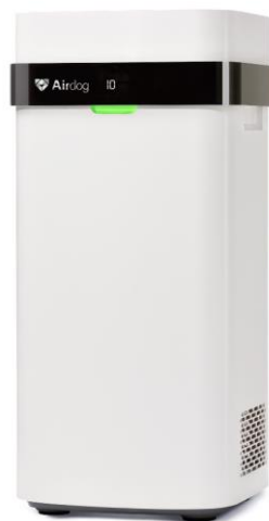
Slika 4.10 Pročišćivač zraka Airdog X5[15]