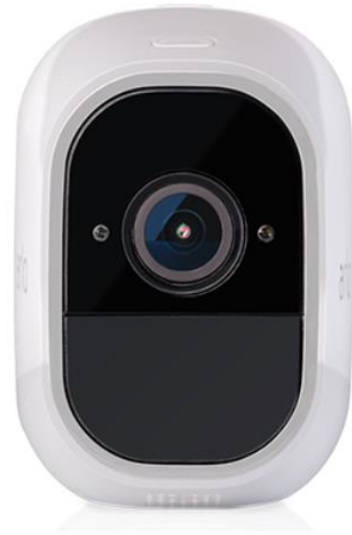
Slika 5.3 Arlo Pro 2 sigurnosna kamera[8]