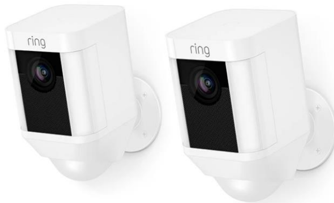
Slika 5.4 Ring Spotlight Cam Battery[9]