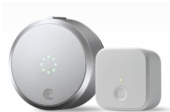
Slika 5.2 August Smart Lock Pro i Wi-Fi modul[7]