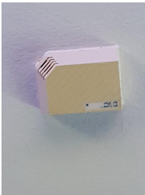
Slika 3.3 Primjer detektora loma stakla

Osim detektora pokreta, kao dodatna sigurnost, ugrađuju se detektori loma stakla (Slika 3.3). Ovi uređaji u sebi imaju ugrađene mikrofone koji detektiraju frekvenciju zvuka loma stakla. Postavljaju se blizu prozora i ostalih otvora sa staklenim površinama.