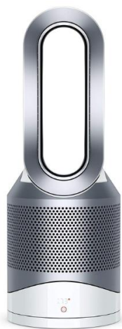
Slika 4.9 Pročišćivač zraka Dyson Pure Hot+Cool[14]