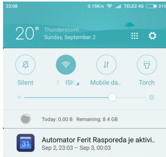
Slika 4.4 - Push notifikacija s događajem dobrodošlice.

Odmah nakon registracije u kalendar će biti dodan događaj dobrodošlice te će on biti vidljiv i u obliku push notifikacije ako su omogućene na samom uređaju, na Slici 4.4 vidljiv je događaj dobrodošlice u push notifikaciji.