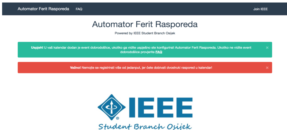
Slika 4.3 - Stranica zahvale.

Nakon što korisnik potvrdi obrazac odobrenja bit će preusmjeren na stranicu zahvale te će mu u kalendar biti unesen event dobrodošlice. Na Slici 4.3 vidimo stranicu zahvale. Stranica zahvale jednostavna je statična stranica koja služi kako bi korisniku dala povratnu informaciju o uspješnoj registraciji i aktivaciji aplikacije.