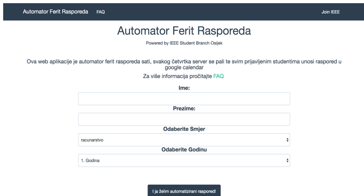
Slika 4.1 - Obrazac za prijavu.

Producersko okruženje aplikacije nalazi se na sljedećem linku: http://35.198.75.154/ . Prezentacijski sloj ove aplikacije relativno je jednostavan i služi samo za aktivaciju aplikacije. Prezentacijski sloj se sastoji od jednog jednostavnog obrasca za unos osobnih podataka o korisniku. Ovi podaci spremi će se u MongoDB bazu podataka. Podaci su potrebni kako bi se mogli unijeti točni podaci o rasporedu, a ti su podaci: ime, prezime, smjer i godinu. Obrazac je vidljiv na Slici 4.1. Unošenje podataka o imenu i prezimenu ostvaruje se slobodnim tekstualnim unosom dok su podaci o smjeru i godini dostupni u padajućim izbornicima.