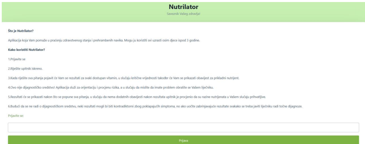
Slika 4.2 Prikaz u pregledniku