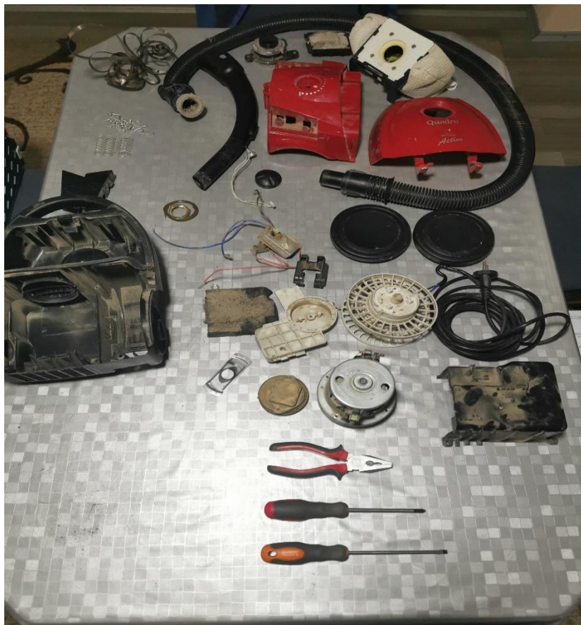
Slika 4.2. Dijelovi usisavača i oprema za rastavljanje usisavača

Prilikom rastavljanja proizvoda, većina dijelova se uspješno odvajala i bez ikakvih poteškoća. Međutim, nastao je i problem u rastavljanju koji je uspješno riješen, iako je to zahtijevalo nešto više vremena. Za rastavljanje usisavača utrošeno je vrijeme od 854 sekunde (malo više od 14 minuta).