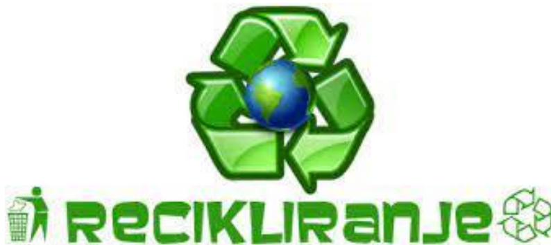
Slika 3.1. Simbol recikliranja [7]