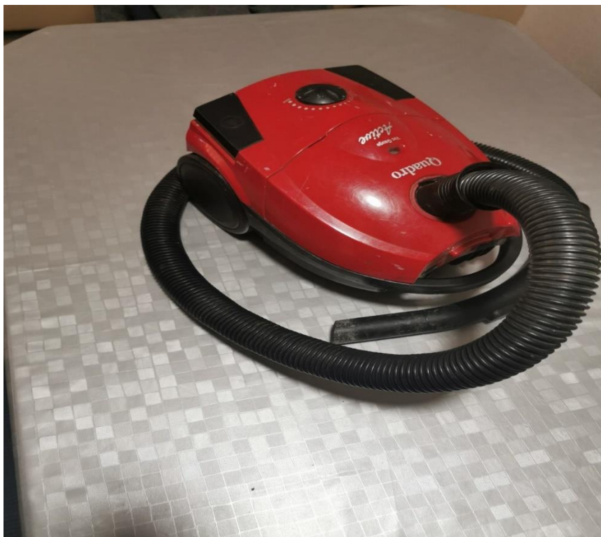
Slika 4.1. Usisivač prašine Quadro

Analiziran je usisivač prašine Quadro snage 1400 W koji je proizveden 2017. godine i mase je 3450 grama. Uzrok dotrajalosti je bio kvar elektromotora.