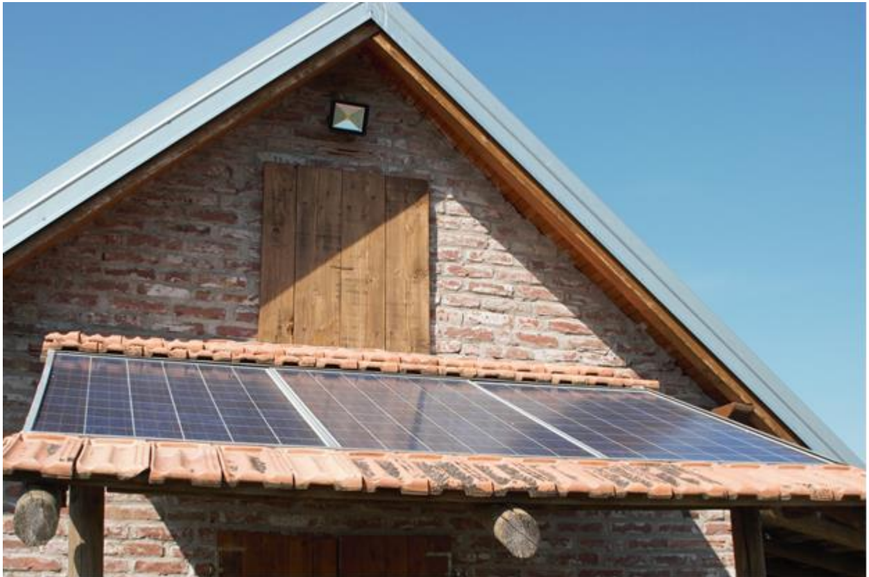
Sl. 3.1. Fotonaponski moduli u okolici Osijeka.

električne energije. Koliko će fotonaponskih modula biti potrebno postaviti odredit će se proračunom ovisno o snazi modula te kapacitetu baterije. Veličina fotonaponskog sustava ne ovisi o veličini posjeda (kvadraturi) nego o broju trošila, odnosno o tome koliko je potrebno električne energije da bi se zadovoljile dnevne potrebe.[2][6][7] Slika 3.1. prikazuje fotonaponske module smještene na krovu vikendice.