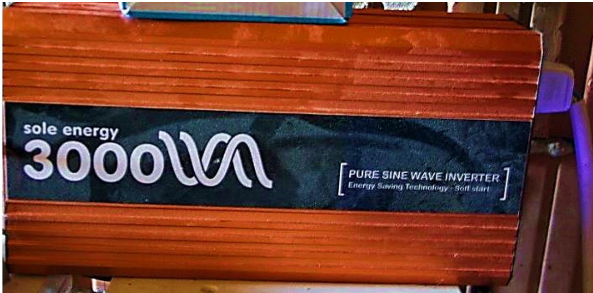
Sl. 3.4. Izmjenjivač koji vrši pretvorbu istosmjernog u izmjenični napon.

Sljedeća komponenta koja je dio fotonaponskog sustava je DC/AC pretvarač (slika 3.4.). DC/AC pretvarač (ili tzv. inverter) je elektronski uređaj koji se koristi za pretvaranje istosmjernog napona koji je prisutan u solarnim baterijama (akumulatorima) vrijednosti 12 V ili 24 V u izmjenični napon poznate vrijednosti od 230 V. [6]