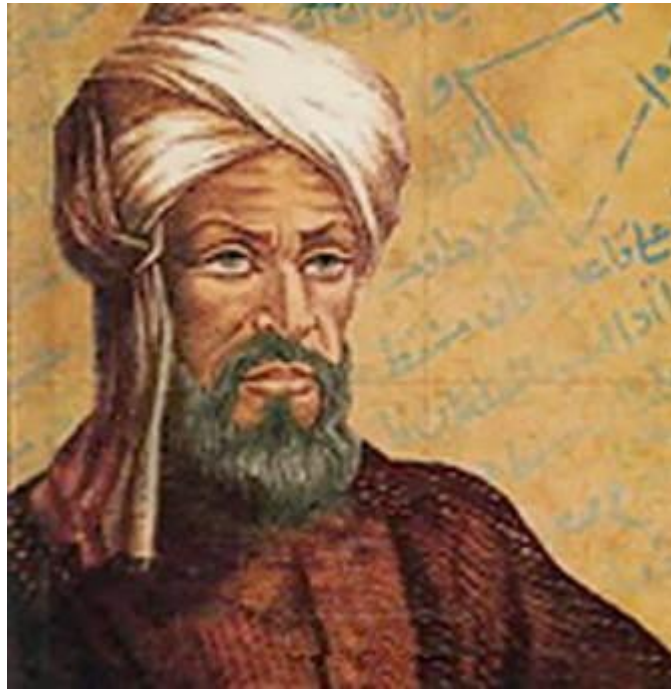
Slika 1.1. Muhamed ibn Musa al Horezmi