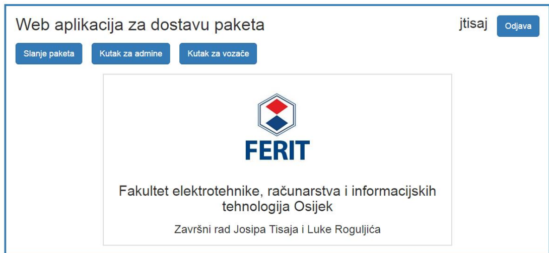
Sl. 4.1 Početna stranica

Naslovna stranica aplikacije napisana je u HTML-u, a korišten je Bootstrap za responzivni dizajn. Vidimo da ima prijava i registracija, ali njih ćemo u idućim poglavljima objasniti. „Slanje paketa“ služi prijavljenom korisniku da naruči slanje paketa na destinaciju koju on želi. „Kutak za admina“ služi da se administratori aplikacije logiraju i onda se vidi cijela povijest naručivanja svih registriranih korisnika. „Kutak za vozače“ služi da vozač koji dobije narudžbu vidi gdje ta narudžba mora biti dostavljena. Prikazano na slici 4.1.