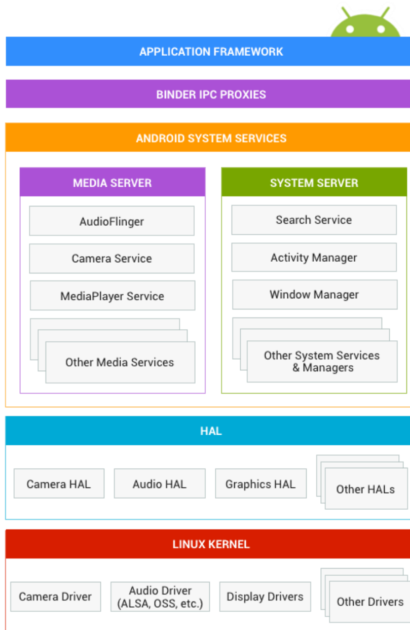
Slika 5. Android arhitektura [15]

Arhitekturu androida možemo zamisliti kao programsku kulu koja sadrži nekoliko razina. Na samom dnu bi bila Linux 2.6 jezgra koji sadrži nekoliko drivera jedan od kojih je i IPC driver čija svrha je izmjeniti podatke između procesa ili unutar istog procesa te Power Management Driver. [14]