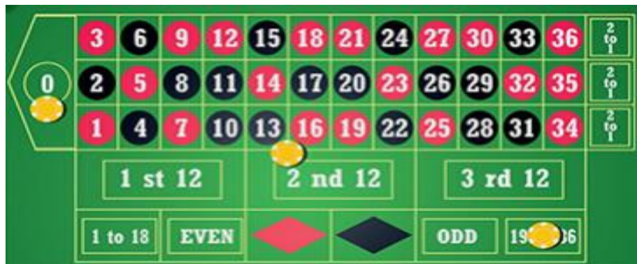
Sl. 4.2. Ulozi

U ovoj metodi ulaže se uvijek ista svota novca (žetona), ali po potrebi moguće je ulagati i progresivno kao u Martingale metodi. Ova metoda pokriva više od pola brojeva na stolu te se tako pokušava povećati šansa za dobitak. Za igru je potrebno 20 žetona koji se ulože kao na slici