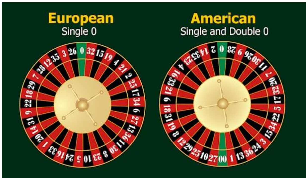
Sl. 3.2. Europski i američki cilindar

Pri tom treba primijetiti da se crveni i crni brojevi, kao i veliki i mali brojevi pravilno izmjenjuju. Ali to nije slučaj s parnim i neparnim brojevima. Na desnoj strani imamo samo pet skupina po dva parna odnosno neparna broja, dok ih je na lijevoj osam skupina.