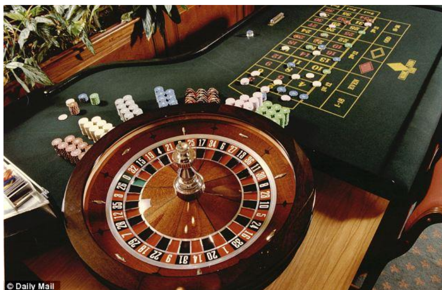
Sl. 3.1. Izgled stola za rulet

Rulet je kompleks sastavljen od rulet kola i rulet stola. Rulet kolo je osnovni dio i sastoji se od stacioniranog drvenog kućišta sa žlijebom unutar kojeg kruži kuglica te unutrašnjeg rotirajućeg cilindra na kojem se nalazi 37 udubljenja (rupa). Svaka je rupa označena crnom ili crvenom bojom od 1 do 36, a samo 0 je označena zelenom. Rupe su ravnomjerno raspoređene na vanjskom dijelu ploče cilindra. Rulet kolo uvijek se vrti u jednom smjeru a kuglica u suprotnom.