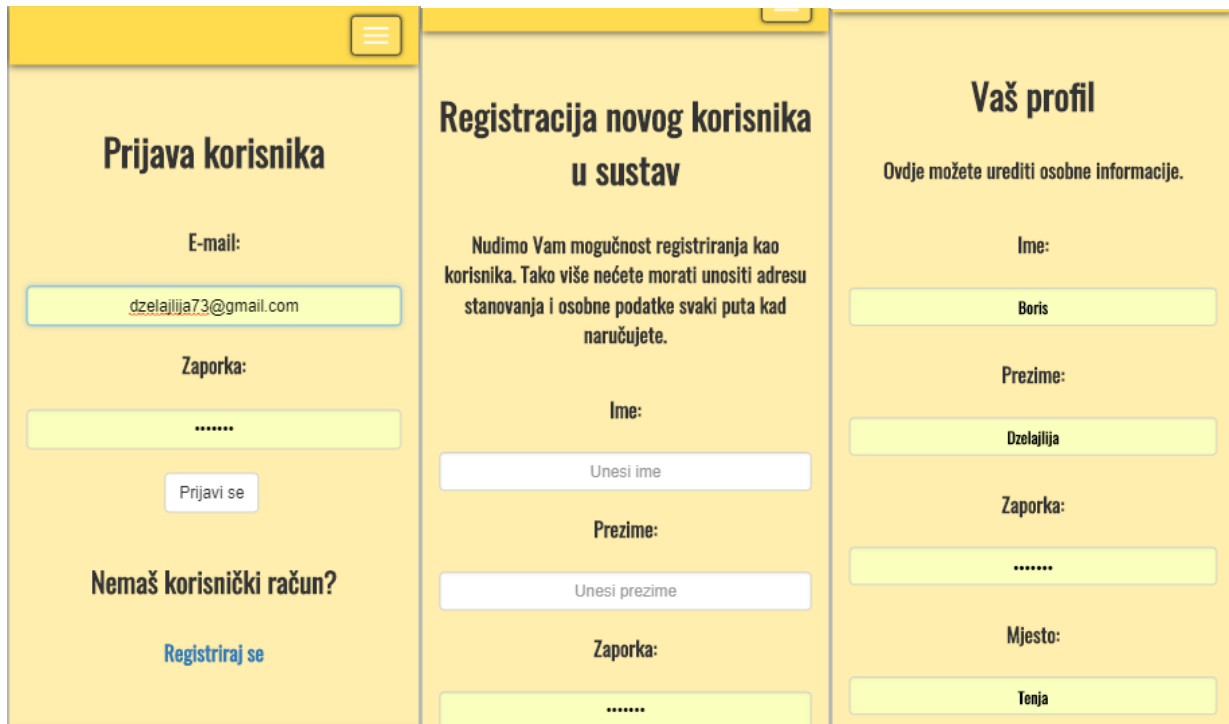
Slika 3.6. – Prikaz prozora „Prijava“, „Registracija“ i „Profil“

žele promijeniti neke svoje informacije, korisnici mogu otići na svoj profil i tamo izvršiti izmjene. Na slici 3.6. mogu se vidjeti ova tri prozora.