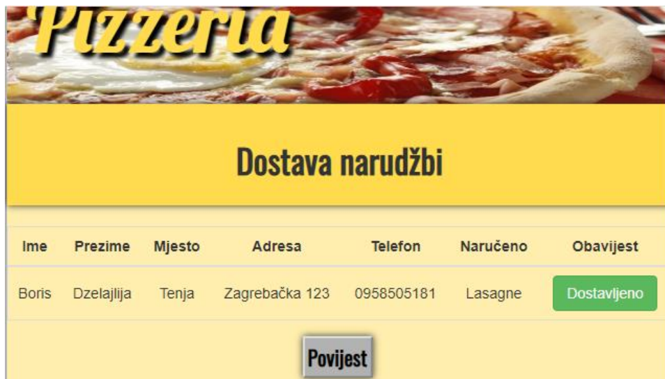
Slika 3.9. – Prokaz prozora „Dostava“