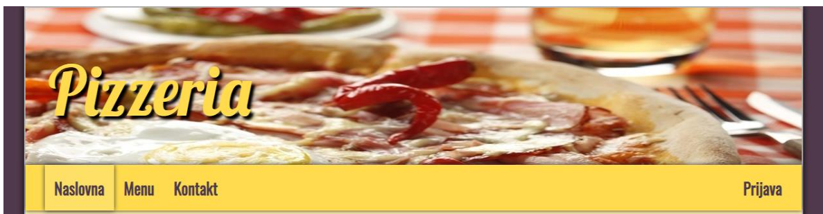
Slika 3.1. – Navigacijska traka

Stranica je koncipirana tako da se ispod naslovne slike nalazi navigacijska traka sa poveznicama na naslovnu stranicu, menu, stranicu za kontakt i stranicu za narudžbu. Na svakoj kartici ove internet stranice položaj navigacijske trake je isti. Na slici ispod se može vidjeti kao to izgleda. Pritiskom na naziv restorana „Pizzeria“, otvara se naslovni prozor. Slika 3.1. prikazuje naslovnu sliku i navigacijsku traku koja je zajednička svim prozorima.