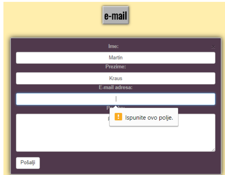
Slika 3.7. – Kontakt forma za slanje elektroničke pošte