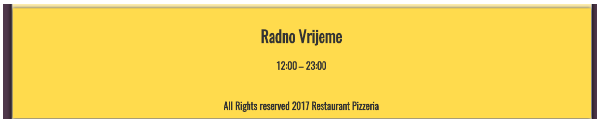
Slika 3.2. – Prikaz podnožja stranice

Na svakoj se kartici (Naslovna, Menu, Kontakt i Prijava) ispod navigacijske trake nalazi sadržaj sukladan nazivu te kartice. Sadržaj svakog prozora ću naknadno prikazati. Sada se fokusiram na zajedničke elemente. Na dnu svake kartice nalazi se podnožje sa informacijom o radnom vremenu restorana. Slika 3.2. prikazuje izgled podnožja stranice ( engl. footer ).