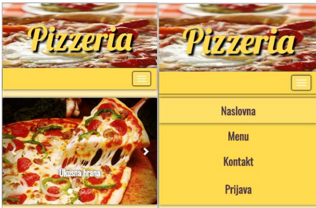
Slika 3.3. – Prikaz mobilne verzije naslovne stranice i navigacijske trake