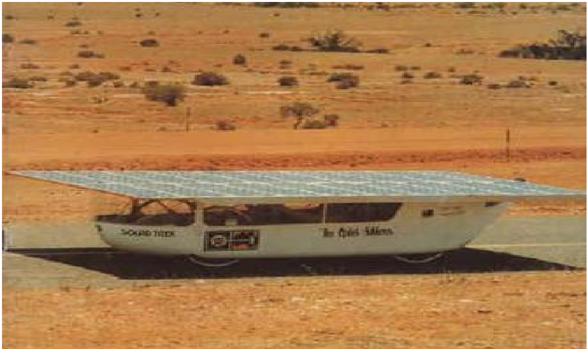
Slika 3.1.1. Quiet Achiever [4]

Preteča današnjih modernih solarnih automobila bio je Sunraycer tvrtke General Motors napravljen 1987.godine (Slika 3.1.2).