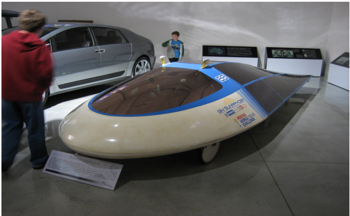
Slika 3.1.2. Sunreycer [5]

Preteča današnjih modernih solarnih automobila bio je Sunraycer tvrtke General Motors napravljen 1987.godine (Slika 3.1.2).