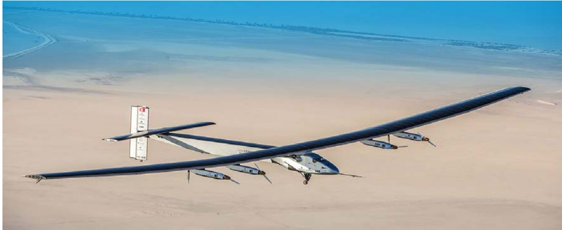
Slika 3.4.1. Solar Impulse [10]