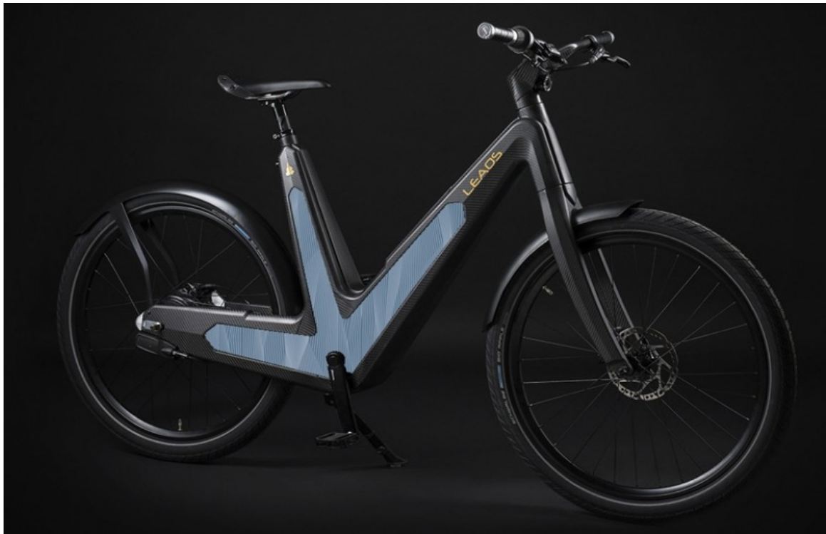
Slika 3.3.1. Bicikl Leaos [9]

jer smanjuju tjelesni napor. Najpoznatiji solarni bicikl je Leaos (slika 3.3.1.). Kostur bicikla izrađen je od karbonskih vlakana, a ne od šupljih cijevi kao kod običnih bicikala. Takav dizajn omogućava integriranje solarnih modula koji mogu proizvesti električne energije dovoljno da se prijeđe 30 km te da se razvije brzina od 45 km/h. Masa bicikla je 22 kg, a kapacitet baterije iznosi 11,6 Ah. Proizveden je u Italiji, a njegova cijena je oko 58 tisuća kuna.[9]