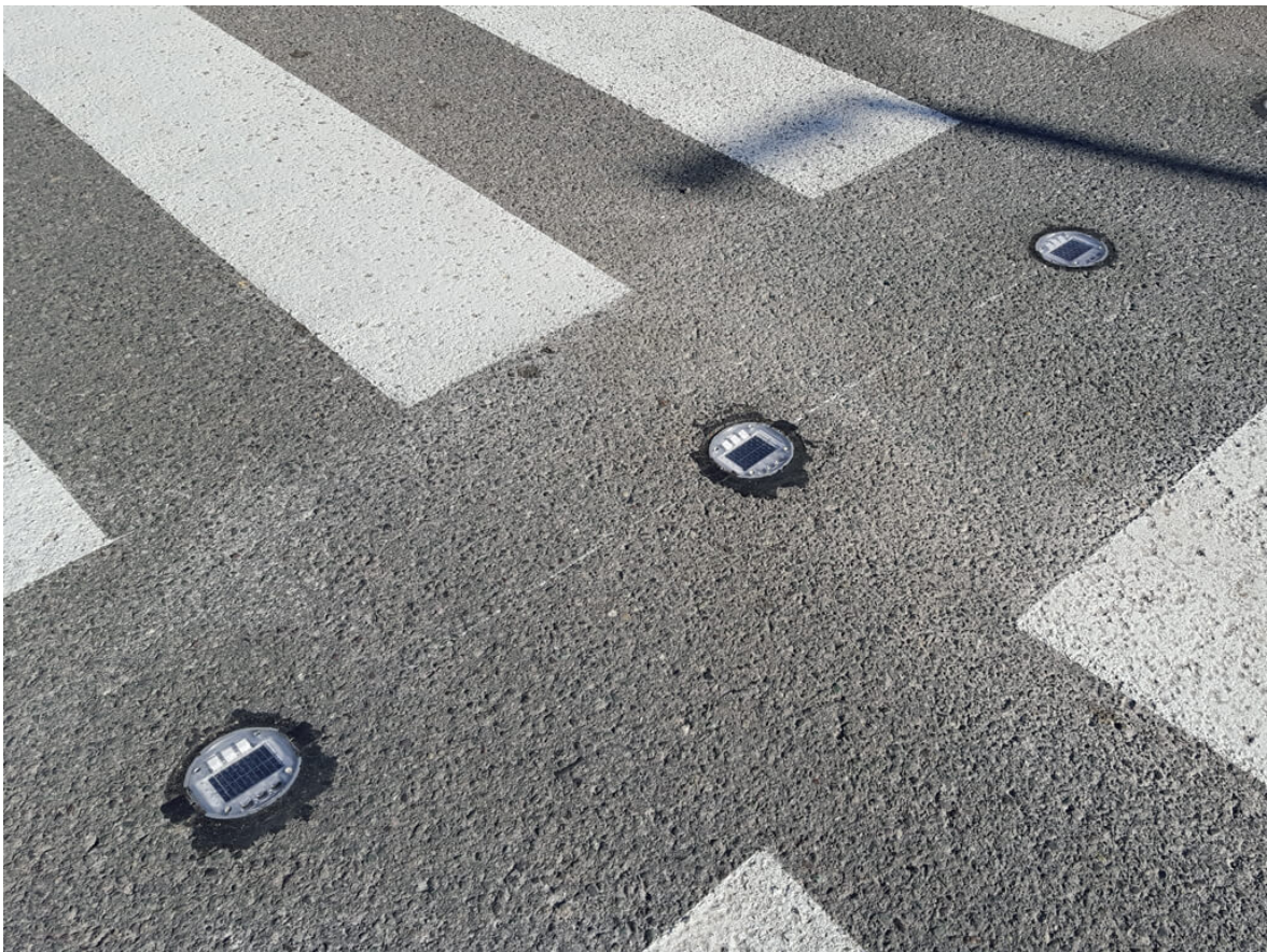
Slika 3.6.2. Solarni LED markeri [13]

U cestovnom prometu zastupljeni su i solarni LED markeri. To su električki uređaji koji služe za upozoravanje vozača na potencijalne opasnosti. Većinom se koriste kod obilježavanja pješćkih prijelaza, ali također se mogu koristiti za obilježavanje središnje i rubne crte kolnika te za slabije osvijetljena i neosvijetljena područja. LED marker prvenstveno radi noću, te danju kod smanjene svijetlosti. Sigurno i kompaktno kućište prilagođava se prvenstveno na cestovne prometnice i izlazi samo 2 mm izvan ceste. Aluminijsko kućište osigurava čvrstoću i otpornost na sve vremenske uvjete, a poklopac od polikarbonata omogućava podnošenje pritiska od 30 tona i prolazak svih vrsta motornih vozila preko njega. Vidljiv je na više od 500 metara, a snaga panela je oko 0.53 W.[13]