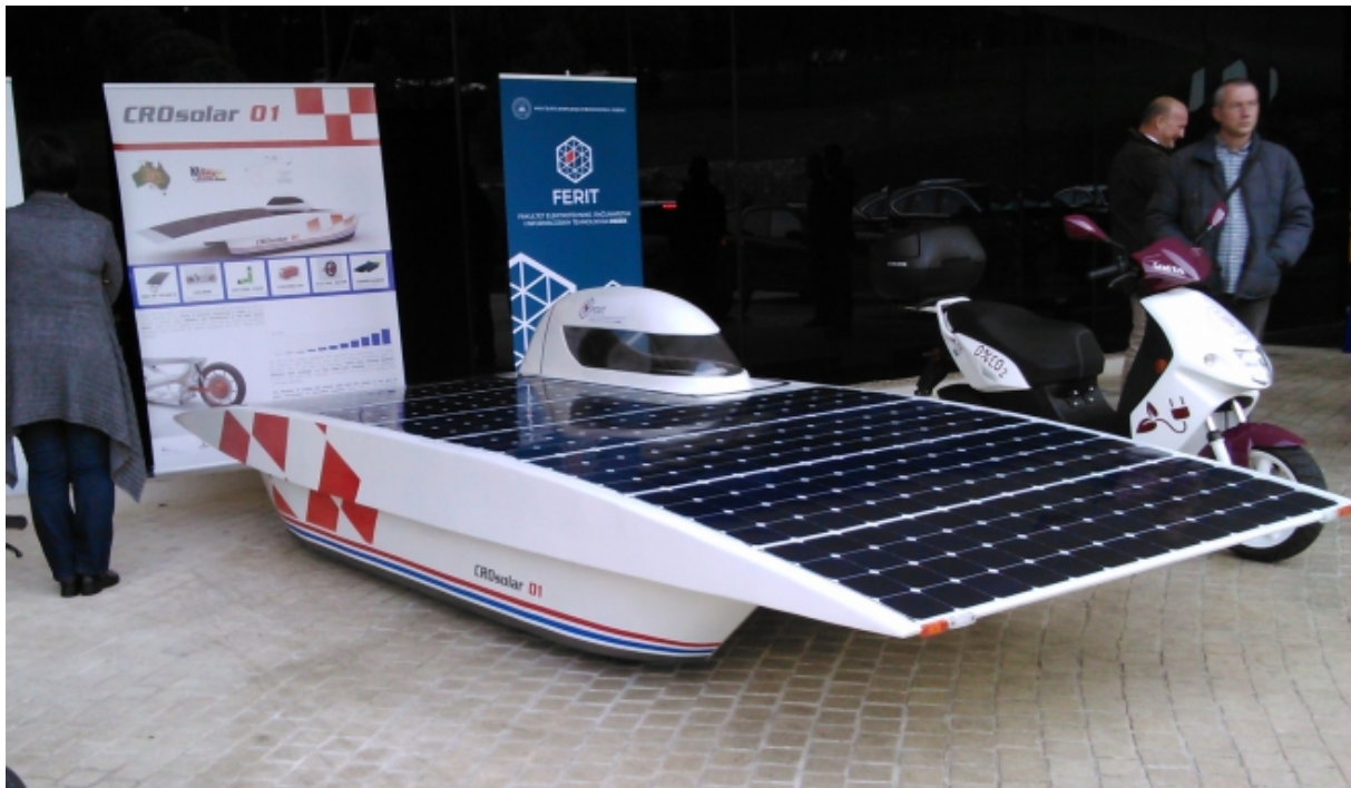
Slika 3.1.3. Solarni automobil FERIT Osijek [6]

Do danas je proizvedeno mnoštvo solarnih automobila. Oni se ne razlikuju previše po principu rada od auta koji su se proizvodili u samim počecima. Sunce je i dalje glavni pokretač, ali iskorištavanje energije je sve modernije i inovativnije sa što manjim gubicima. Puno škola i fakulteta sve više osmišljava svoje koncepte vozila (Slika 3.1.3.), ali i većina automobilskih tvrtki prate nove trendove i sve više razvija tzv. automobile budućnosti od kojih će se neki nabrojati i opisati.