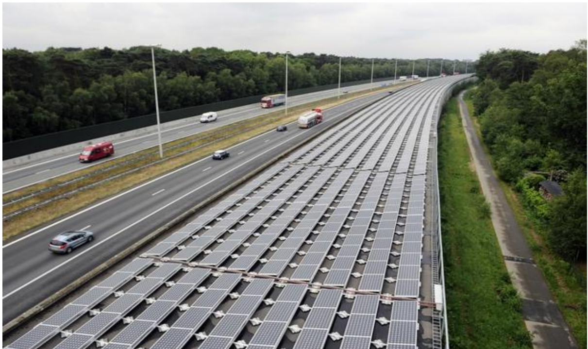
Slika 3.5.1. Solarni tunel [11]

Solarni vlak koji ima svoje solarne module i koristi solarnu energiju za svoj pogon još nije proizveden, no 2011. prvi puta je pušten vlak koji na jednoj dionici kao pogonsko gorivo koristio struju iz solarnih ploča koje su postavljene iznad tunela kojim prolazi. On se nalazi u belgijskom gradu Antwerpenu i osim za napajanje solarnog vlaka, tunel služi i za napajanje samog grada. Dužina tunela je 3,6km i sastoji se od 16000 ploča.[11]