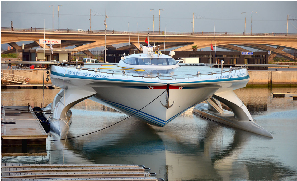
Slika 3.2.1. Planet Solar [8]

Ovakav sustav omogućava sigurno pokretanje motora , visoku učinkovitost te duži vijek trajanja akumulatora. Jedno od najpoznatijih solarnih plovila je Planet Solar (slika 3.2.1.) , katamaran koji je za pogon svojih elektromotora u potpunosti opskrbljen sunčevom energijom. Solarna energija se pohranjuje u njegove litij-ionske baterije . Sagrađen je u Njemačkoj i u slučaju nepovoljnih uvjeta, odnosno ako nema sunca, može ploviti tri dana bez punjenja. Njegova dužina je 31 metar, gornji dio plovila prekriven je s 537 m 2 solarnih ploča koje su snage 93 kW i koje napajaju 2 električna motora. Može doseći brzinu do 26 km/h i cijena mu je 15 milijuna eura.[8]