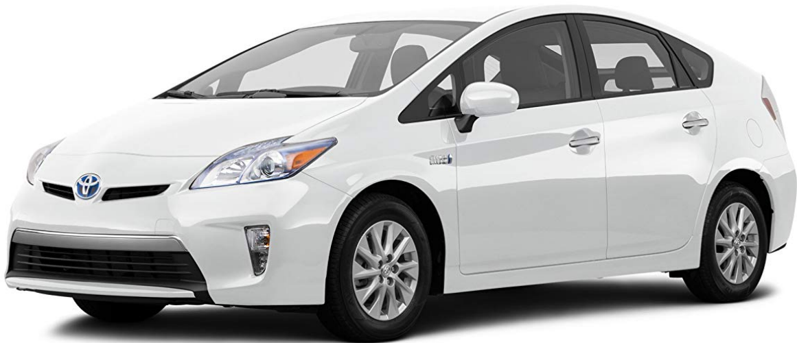
Slika 5.1.1. Toyota Prius [17]

Kada se uspoređi hibridni auto i električni teško je odlučiti koja je opcija bolja. Prednost hibridnog automobila je mogućnost vožnje na dva pogona i zbog toga se dobiva efikasnost električnog automobila u gradskoj vožnji i na nekim kraćim relacijama, te dodatnih 300-tinjak kilometara koji se mogu prevaliti koristeći drugi pogonski sustav. Kod električnog auta to nije slučaj jer oni mogu voziti dok se ne isprazni baterije, a njihov domet bez ponovnog punjenja još uvijek nije toliko velik. U drugu ruku, ako vozači žele potpuni doživljaj električnog vozila, ako su ekološki osviješteni uvijek će birati električno vozilo koje nema emisiju štetnih plinova jer kod električnih vozila nema korištenja fosilnih goriva. Osim toga, kod električnih vozila veća je ušteda jer postoje besplatne punionice, dok kod hibrida uvijek mora biti i drugo pogonsko gorivo koje je puno skuplje.