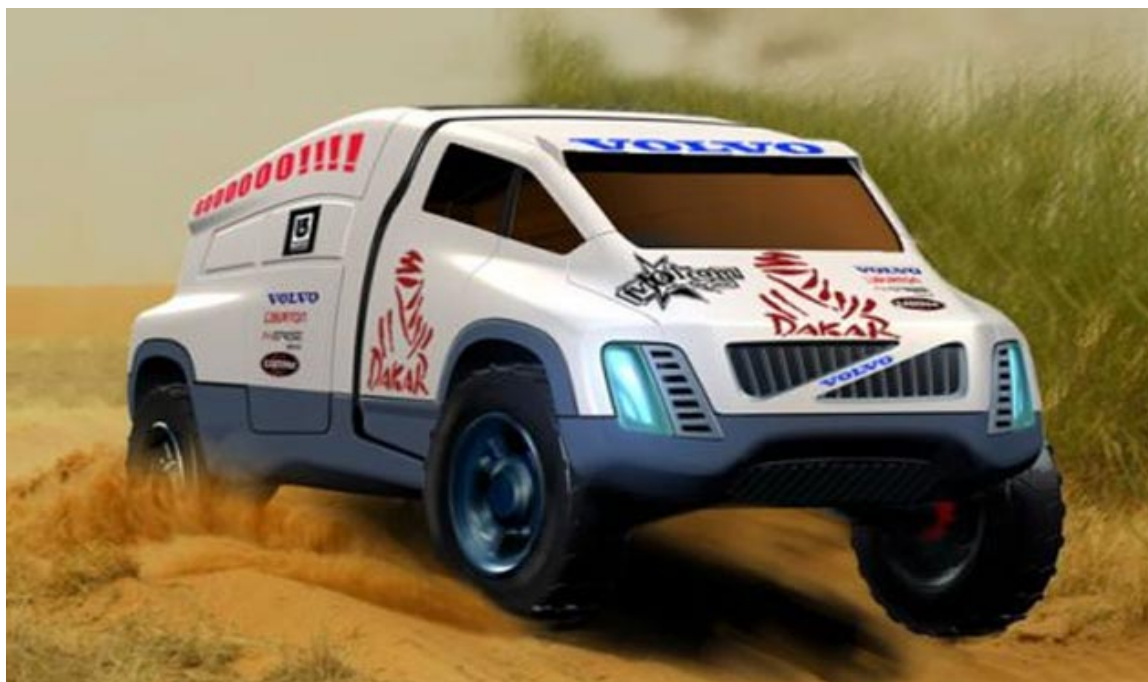
Slika 3.1.4. Solarni Volvo [7]

Slijedeći automobil iz kategorije Automobili budućnosti je Giugiaro Quaranta (slika 3.1.5.). Zsigurno izgledom najuglađeniji solarni automobil koji se u potpunosti napaja solarnom energijom preko modula koji se nalaze cijelom dužinom automobila, odnosno na prednjem dijelu automobila i na krovu. Dizajn je to tvrtke Italdesign Giugiaro kojemu je pomogla i Toyota radi što bolje izvedbe ovog modela.[7]