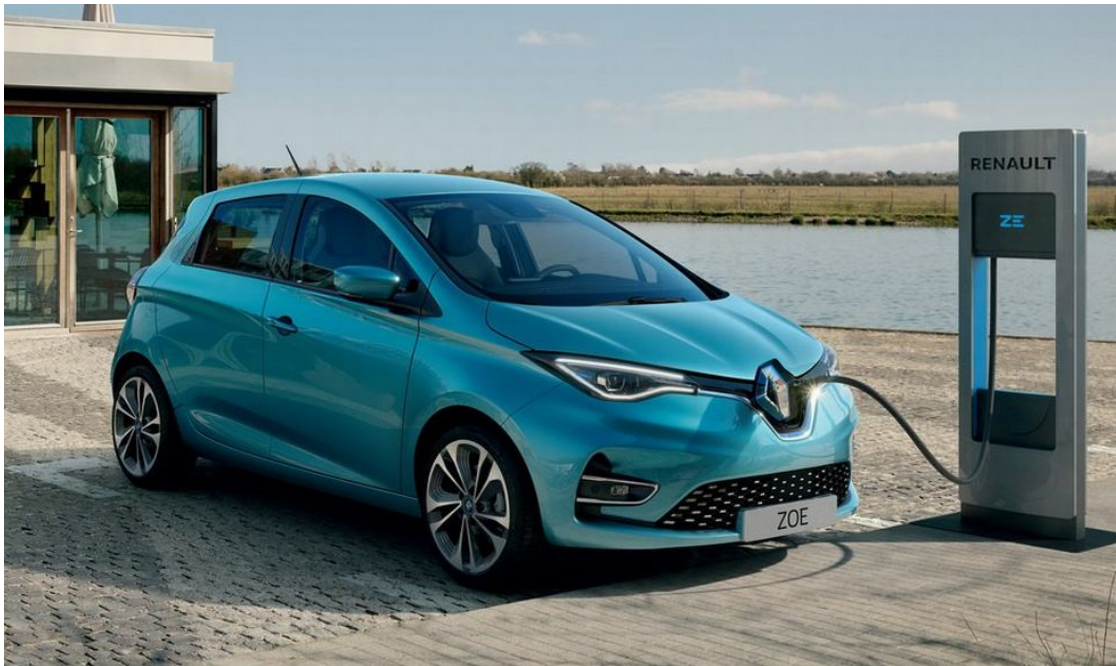
Slika 5.2. Renault Zoe ZE50 [16]

za 16 godina što je već malo duže vrijeme u kojem se treba uzet u obzir i servisiranje, tj. barem jedna promjena baterije. Zaključak je da ako osoba na godišnjoj razini ,zbog posla ili nekih drugih obveza prijelazi puno više kilometara od prosjeka, električni auto će se itekako isplatiti.