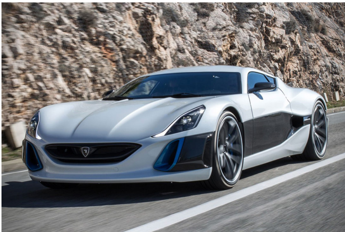
Slika 5.1. Rimac Concept One model [15]

Concept One automobil tvrtke Rimac doseže maksimalnu brzinu od 305 km/h. To je automobil snage 1088 KS, domet mu je oko 600 km, a snaga baterije 92 kWh. Masa ovog automobila iznosi 1850 kg. Pogone ga 4 elektromotora te brzinu od 100 km/h postiže u vremenu od 2,8 sekundi. Proizvodi se od 2013.godine, a njegova cijena je 750000 eura.[15]