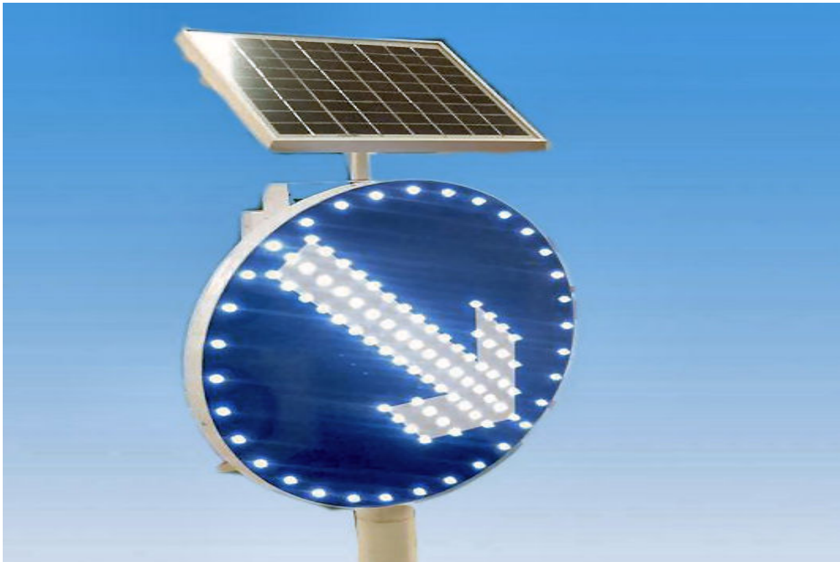
Slika 3.6.1. Solarna prometna signalizacija [12]

Jedna od najvažnijih stavki u prometu je ta da se treba osigurati sigurnost svih sudionika. To ponajviše ovisi o samim vozačima, no njima se trebaju osigurati i što bolji uvjeti. Jedan od tih uvjeta je i što bolja uočljivost prometnih znakova koja se osigurava korištenjem LED solarnih prometnih znakova. Solarna prometna signalizacija ovisi o tome kakav je režim korištenja i na kojoj lokaciji se postavlja, no bez obzira na to najbitnije karakteristike signalizacije na solarnu energiju su kvaliteta, sigurnost, dizajn, te pouzdanost. Postoje razne primjene solarne energije u prometnoj signalizaciji kao primjerice rasvjeta križanja i pješačkih prijelaza, prometni znakovi s unutrašnjom rasvjetom , SOS telefonski sustavi i slično. Neke od brojnih prednosti solarne prometne signalizacije su te što nema kopanja u svrhu polaganja kablova, ona se jednostavno instalira na predviđenu lokaciju ,te samim time nema ni uništavanja okoliša nepotrebnim rušenjem postojećih puteva ili cesta. Ipak najvažnije prednosti su naravno te što nema troškova električne energije i laki su za održavanje.