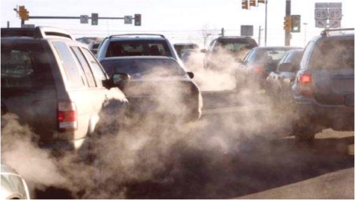
Slika 2.1 Ispušni plinovi automobila [2]