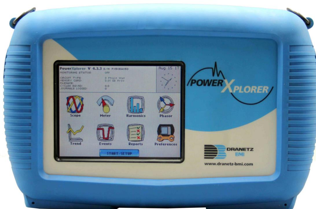
Slika 2. Zaslona Power Xplorer 5 uređaja

Na poledini se nalazi polje s punjivim zamjenjivim baterijama. S donje strana instrumenta nalazi se memorijska kartica, tri LED diode i prekidač te utor za punjenje baterija. Memorijska kartica služi za pohranjivanje podataka pri nadzoru parametara. Za PX5 mora se koristiti memorijska kartica proizvođača DRANTZ – BMI zbog brzine pohrane podataka. Odjednom može sadržavati više memorijskih kartica ali mogu raditi samo jedna po jedna. Gledajući s lijeva na desno, prva LED dioda nam govori o stanju baterije. Ako mirno svijetli znači da se baterija puni, a ako titra znači da je baterija puna. Srednja LED dioda ne svijetli instrument radi normalno, no ako se utvrdi abnormalno stanje ova LED dioda će se upaliti. Zadnja LED dioda pri normalnom radu titra jednom po sekundi. Početni zaslon možemo podijeliti na četiri dijela. Na vrhu zaslona nalaze se informacije o stanju što uključuje stanje nadzora, stanje memorijske kartice, ime i oznaku datoteke te vrijeme i datum. Prvi red ikona povezan je s trenutnim mjerenjima i pokazuje trenutne veličine parametara. Drugi red ikona služi za prikaz pohranjenih datoteka (kao grafikone ili kao valne oblike) te izvješća o podacima norme EN50160. Također se u drugom redu nalaze i postavke instrumenta. Na dnu zaslona nalazi se tipka START koja omogućuje pokretanje nadzora električne energije [7].