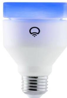
Slika 5.6 Lix žarulja u boji[11]

svojom infracrvenom žaruljom koja je namijenjena za proširivanje vidnog polja sigurnosnih kamera. Kako bi se povezali na mrežu nisu potrebni centralni uređaji, nego se oni spajaju direktno na Wi-Fi mrežu.[1]