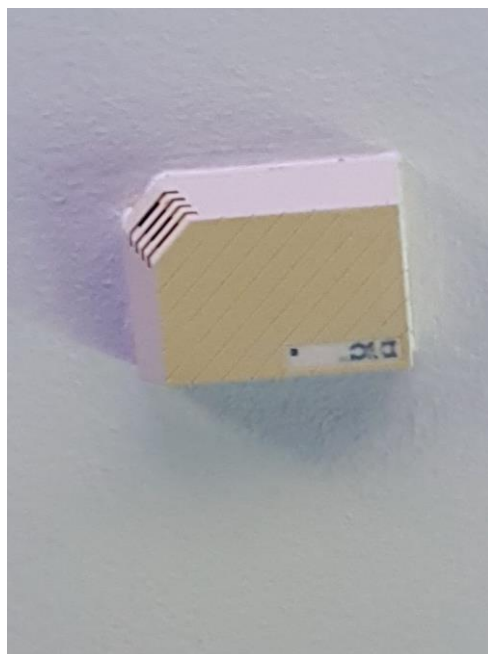
Slika 3.3 Primjer detektora loma stakla

Osim detektora pokreta, kao dodatna sigurnost, ugrađuju se detektori loma stakla (Slika 3.3). Ovi uređaji u sebi imaju ugrađene mikrofone koji detektiraju frekvenciju zvuka loma stakla. Postavljaju se blizu prozora i ostalih otvora sa staklenim površinama.