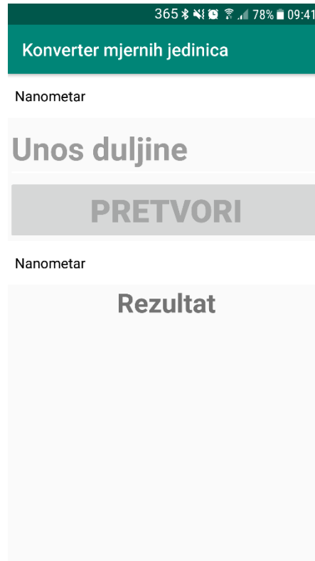
Slika 2.2. Grafički prikaz aktivnosti Duljina

bijeli padajući izbornik, ispod bijelog padajućeg izbornika se nalazi svijetlo sivo polje u koje korisnik unosi vrijednosti. Ispod polja za unos se nalazi tamno sivi gumb koji se koristi za pretvaranje mjerne jedinice. Ispod tog gumba se nalazi drugi bijeli padajući izbornik koji služi za odabiranje mjerne jedinice u koju korisnik želi pretvoriti početnu mjernu jedinicu. I ispod toga se nalazi polje u kojem se ispisuje konačan rezultat. Ove boje i nijanse tih boja su odabrane zbog toga da bi se aplikacija mogla koristiti i u prirodi, odnosno da bi se što bolje vidjela i pri izravnoj sunčevoj svjetlosti.