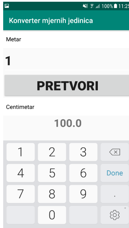
Slika 2.3. Grafički prikaz rada aktivnosti duljina