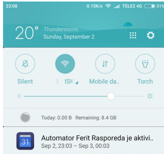
Slika 4.4 - Push notifikacija s događajem dobrodošlice.

Odmah nakon registracije u kalendar će biti dodan događaj dobrodošlice te će on biti vidljiv i u obliku push notifikacije ako su omogućene na samom uređaju, na Slici 4.4 vidljiv je događaj dobrodošlice u push notifikaciji.