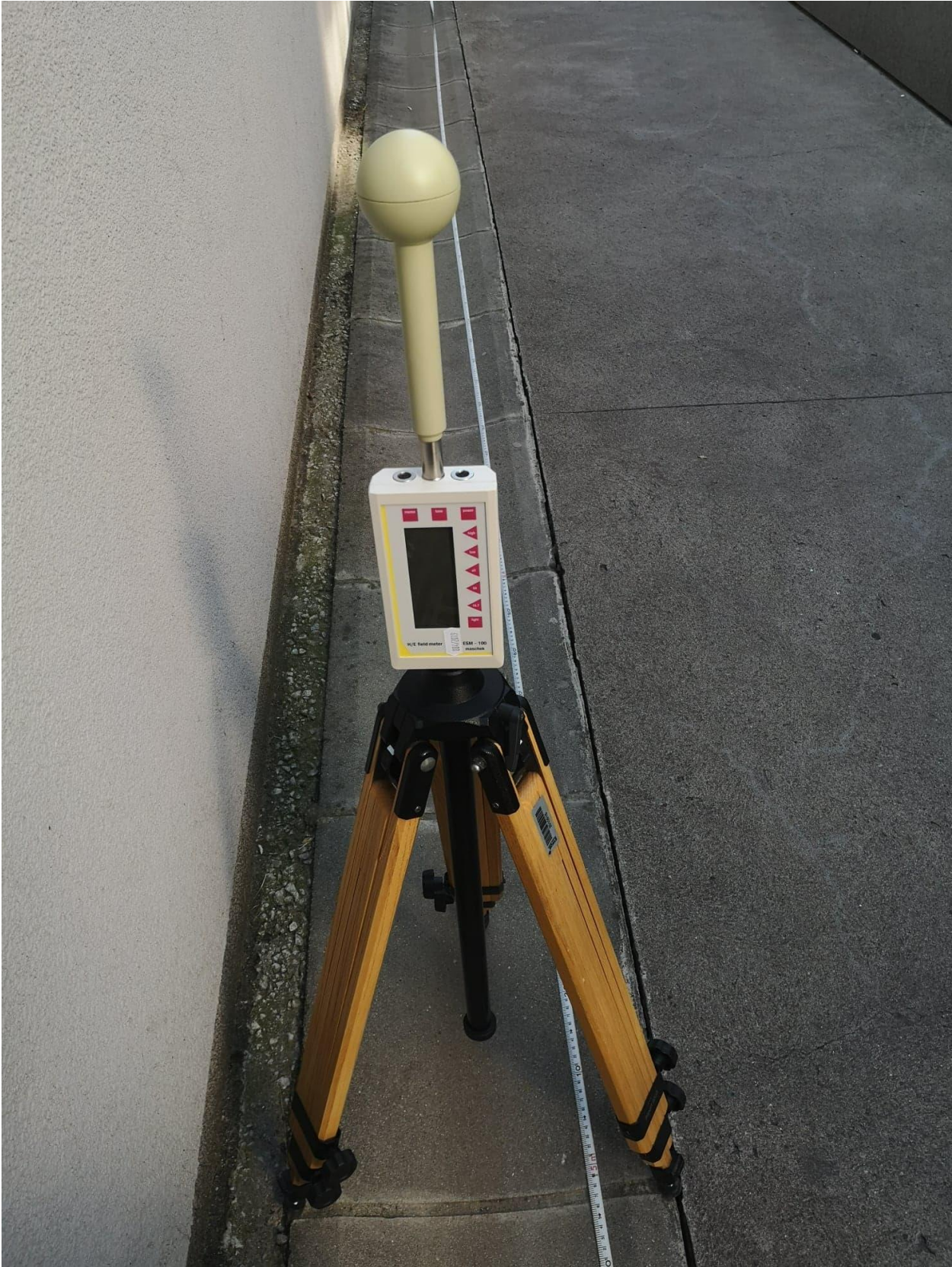
Slika 2.4. Mjerenje instrumentom MASHEK ESM-100