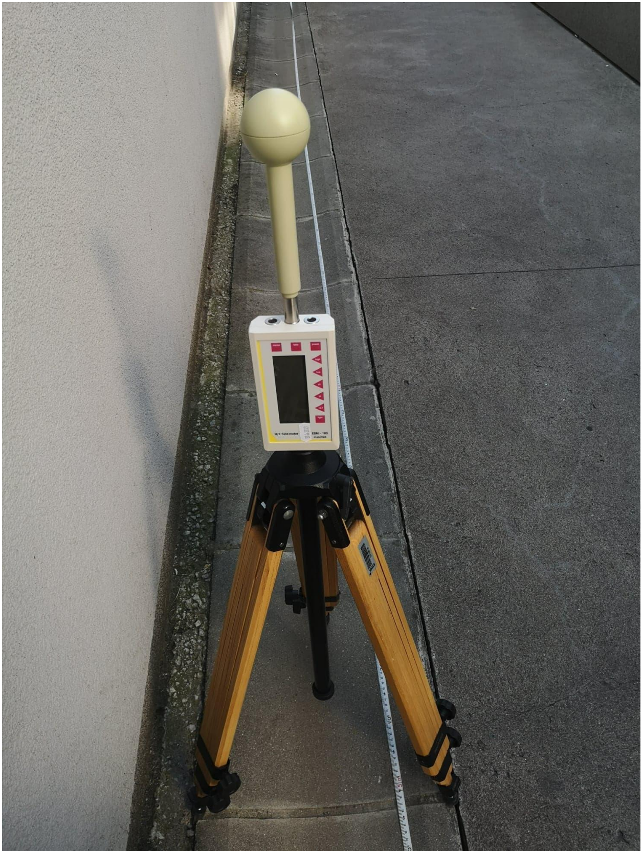
Slika 2.4. Mjerenje instrumentom MASHEK ESM-100