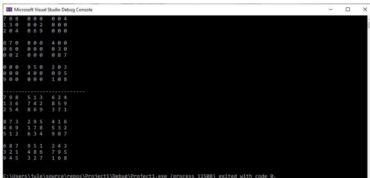
Sl. 4.8. Sudoku i njegovo rješenje

Funkcija ispisiSudoku je vrsta void funkcije koja kao paramater prima polje cjelobrojnih brojeva koje predstavlja Sudoku zagonetku. Pomoć for petlji, funkcija ispisuje vrijednosti Sudoku-a. Ukoliko je uvjet if naredbe „ (stupac+1) \% 3 == 0 “ vrijednosti true , funkcija će nakon svakog trećeg stupca dodati još jedan razmak između vrijednosti zbog bolje preglednosti. Također, ukoliko je uvjet if naredbe „ (red + 1) \% 3 == 0 “ vrijednosti true , funkcija će omogućiti prijelaz u novi red zbog bolje preglednosti.