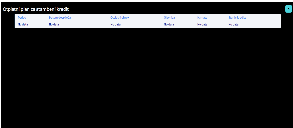
Slika 3.30. Prikaz prazne modalne tablice u korisničkom sučelju