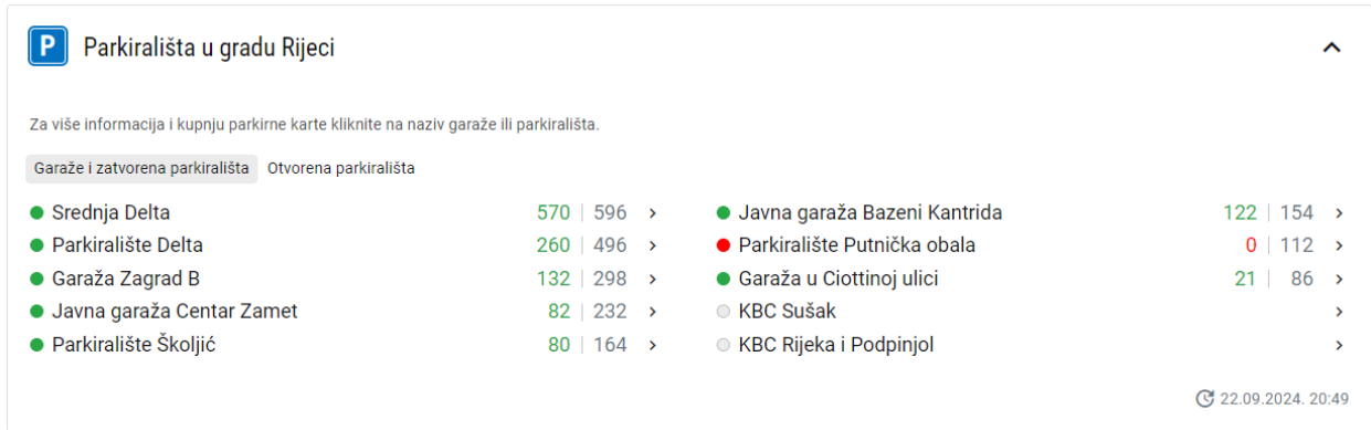
Slika 3.2. Prikaz popunjenosti otvorenih parkinga i garaža na RCC portalu[7].

Za primjer upotrebe prikupljanja senzorskih podataka kod praćenja popunjenosti parking možemo uzeti grad Rijeku koji je uveo sustav koji prati stvarno stanje popunjenosti garaža i otvorenih parkinga u gradu te informacije o istome dostavlja građanima putem portala „Rijeka City Card“.