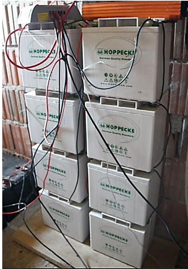
Sl. 3.3. Solarne baterije spojene serijski i paralelno.

te se odabiru kada se planira česta uporaba fotonaponskog sustava kao u slučaju navodnjavanja. Baterijama (Sl.3.3) se omogućava da crpka ima na raspolaganju dovoljno uskladištene energije. U slučaju nedovoljne osunčanosti kada fotonaponski moduli ne proizvode dovoljnu količinu energije crpka se napaja iz baterija.