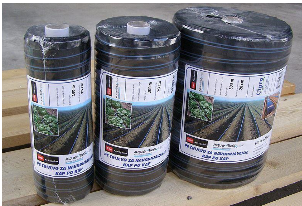
Sl. 4.1. Rupičasta crijeva prije postavljanja u sustav navodnjavanja.

Voda koju crpka crpi iz spremnika najprije dolazi do glavnog ventila kojim se omogućuje ili ne omogućuje danji protok vode, ovisno o potrebama potrošača. Voda do odredišta dolazi kroz cijevi. Cijevi mogu biti istog promjera ili različitih promjera. U slučaju različitih promjera, cijevi moraju biti spojene spojnicama kako bi postale kompatibilne (pravilan protok bez gubitaka na spojevima). Na crijeva kod kojih počinju redovi kulture koju se navodnjava stavljeni su obično mali ventili na koje se nastavljaju rupičasta crijeva (slika 4.1), odnosno crijeva kap na kap koja služe kao prskalice.