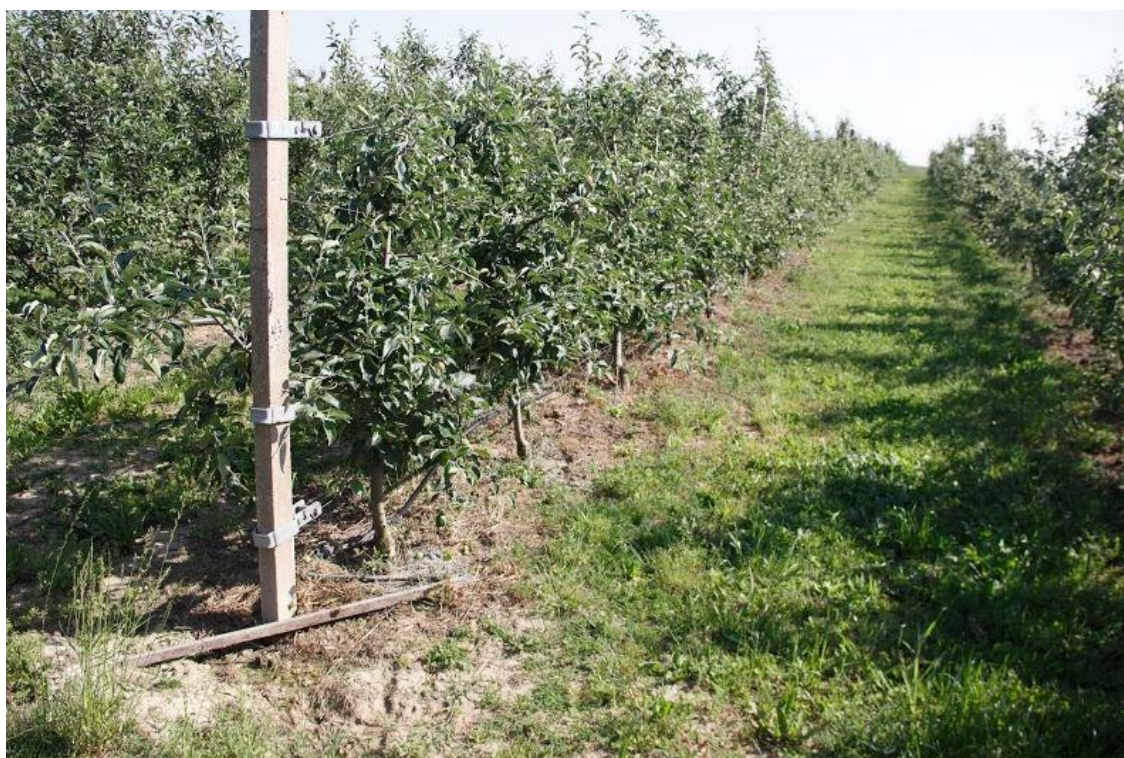
Sl. 5.1. Voćnjak na čijoj će se površini provoditi solarno navodnjavanje.

Odabrana površina za koju će se izvršiti proračun je voćnjak koji se nalazi u okolici Osijeka i prikazan je na slici 5.1.