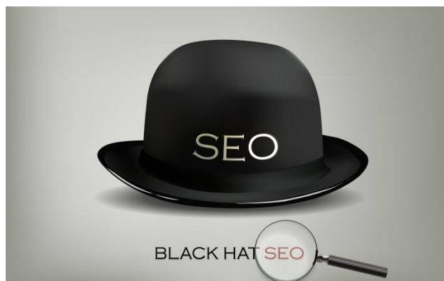
Sl. 6.3. SEO crnog šešira

Web tražilice mogu otkriti i kazniti uporabu black hat SEO metoda tako što će otkrivenim web stranicama smanjiti rang ili ih potpuno izbaciti iz rezultata pretraživanja. Poznat je slučaj iz 2006. godine kada je Google otkrio uporabu black hat metoda na stranicama njemačkoga proizvođača automobila BMW -a. Stranice su izbačene iz Google -ovog indeksa, BMW se ispričao, preuredio svoje web stranice i Google ih je ponovo uvrstio u svoj indeks.[24]