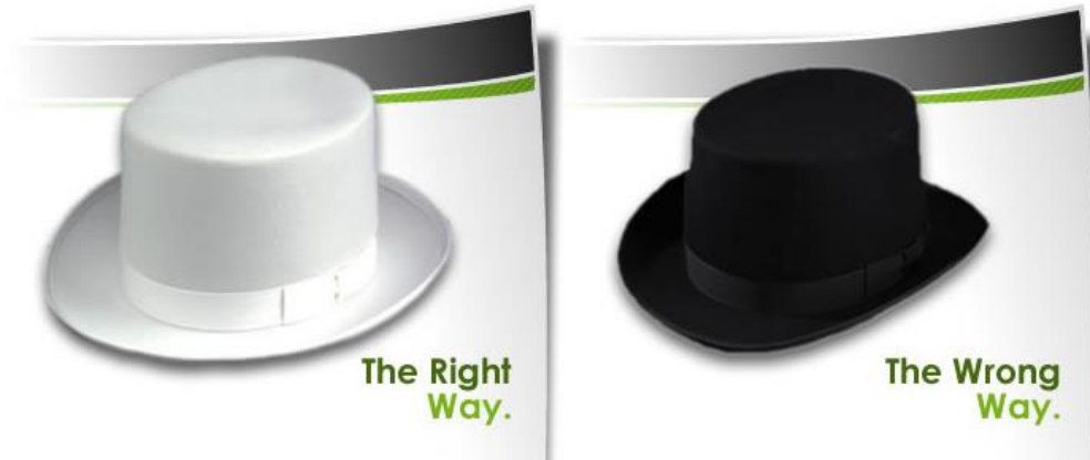
Sl. 6.1. Bijela i crna SEO tehnika

SEO, kao i sve ostalo u životu ima pozitivnu, dobru stranu te lošu, negativnu pa se tako i SEO tehnike mogu svrstati u dvije kategorije: tehnike koje pretraživači preporučuju koje uvelike pridonose boljoj rangiranosti na listi pretrage i one tehnike koje pretraživači ne odobravaju pa su takve stranice u većini slučajeva kažnjene zbog metoda kojima se služe, ukratko, neetične su. Takve se tehnike klasificiraju kao bijeli šešir ( eng. white hat ) i crni šešir ( eng. black hat ) SEO. Tehnika SEO bijelog šešira općenito osigurava bolje i dugotrajnije rezultate, dok se za tehniku SEO crnog šešira očekuje da će njihove web stranice u konačnici biti privremeno ili trajno zabranjene odnosno izuzete sa liste pretrage kada se primijete tehnike kojima se služe. Također postoji i SEO tehnika sivih šešira ( eng. gray hat ) koja se koristi dopuštenim i ne dopuštenim tehnikama.