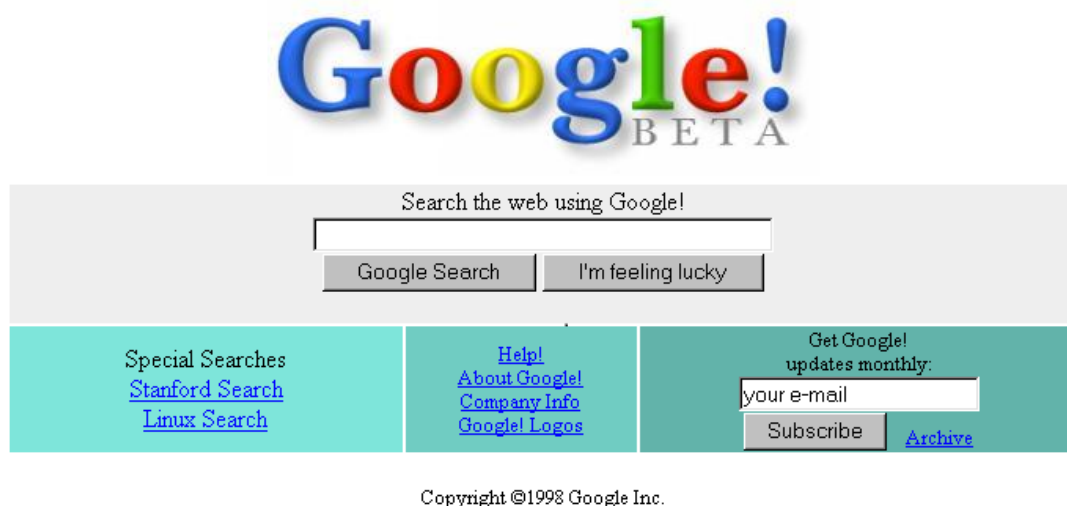
Sl. 3.2. Izgled prve Google-ove stranice

Page i Brin su za vrijeme studiranja, 1994. godine započeli rad na Google -u kao projekt za vrijeme studiranja. Google (slika 3.2.) se tada sastojao od jednostavog dizajna u usporedbi sa ostalim tražilica koji se svidio korisnicima pa se tako postepeno, ali konstantno uporaba tražilice povećavala i postajala sve popularnija u Americi.