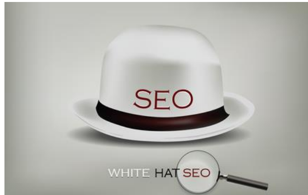
Sl. 6.2. SEO bijelog šešira

rangiranje iste poboljšati te daljnjim unaprjeđenjem ostaje na istom ili postiže bolje rezultate na listi pretrage tražilice.