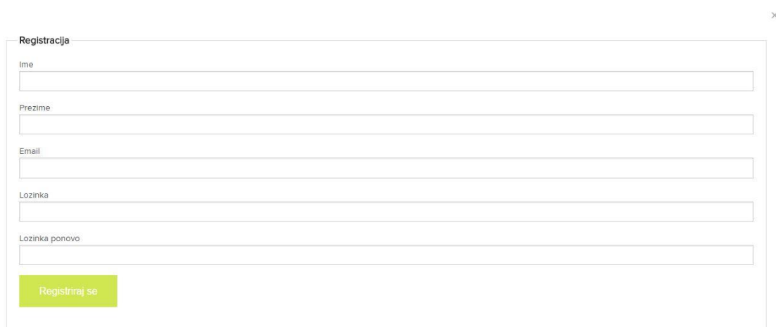
Sl. 6.2. Registracija

Prilikom dolaska na početnu stranicu korisnik se treba registrirati ukoliko želi kreirati vlastiti projekt ili podržati postojeći. Registracija traži od korisnika osnovne informacije kao što su ime, prezime, email te lozinku kao što je prikazano na slici 6.2.