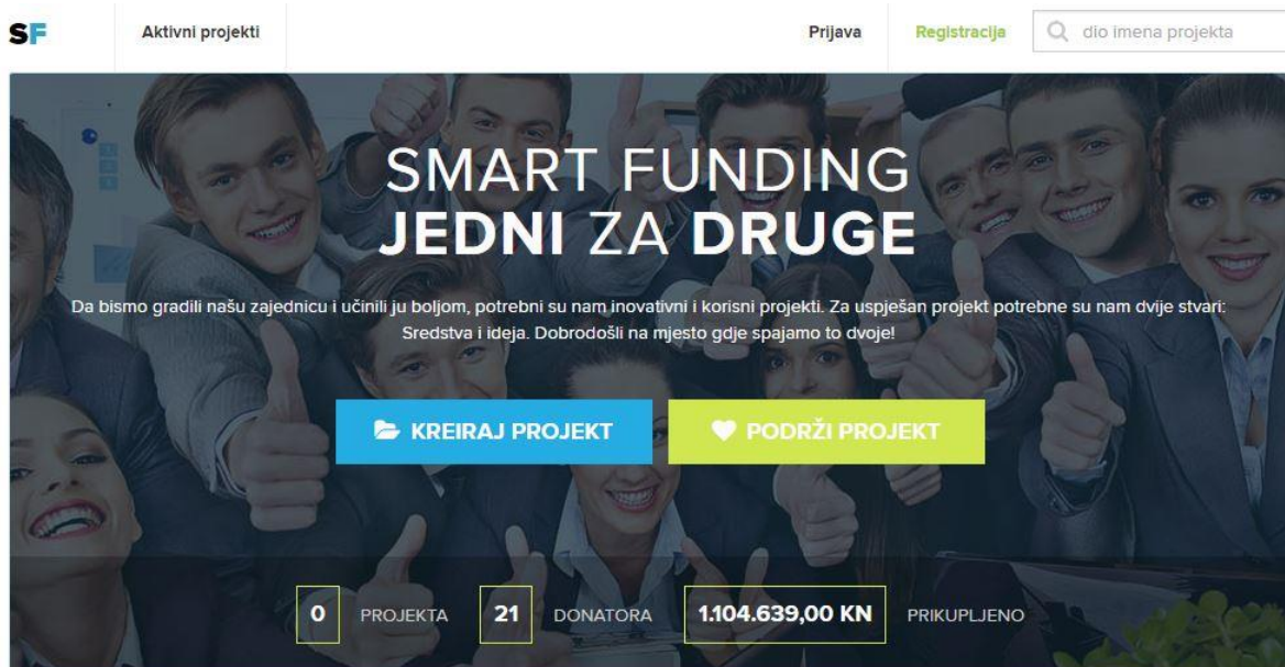
Sl. 6.1. Početna stranica

Kao rezultat ovog završnog rada je stranica za grupno financiranje ideja. Pri izradi stranice korištene su tehnologije opisane u prijašnjim poglavljima. Na početnoj stranici u navigaciji se nalazi linkovi za aktivne projekte, prijavu, registraciju te tražilica kao što je prikazano na slici 6.1.